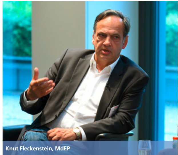
Knut Fleckenstein, MdEP

zum Teil durch überdurchschnittliche Anwesenheitsquoten und zahlreiche Redebeiträge auf, partizipieren aber kaum an den inhaltlichen Aushandlungsprozessen der Politikgestaltung. An der Ausschussarbeit beteiligen sich Rechtsaußen-Parteien laut der Jenaer Studie nur unterdurchschnittlich, die Präsenz ihrer Vertreter ist dort deutlich niedriger als im Plenum.