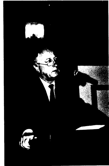
prof. Heinrich August Winkler / Prof. Heinrich August Winkler