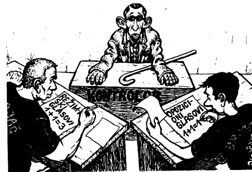
Izborni materijal se proverava prebrojavanjem, a ne sabiranjem.

Do svih ovih podataka se dolazi isključivo prebrojavanjem, a ne sabiranjem ili oduzimanjem da bi se brojke uklopile. Kad se dobije neki od rezultata, on se unosi u zapisnik, da bi se otklonila mogućnost kasnijih manipulacija. To, dakako, podrazumeva veoma pažljivo brojanje - najmanje dva puta sa istim rezultatom za svaki od navedenih podataka.