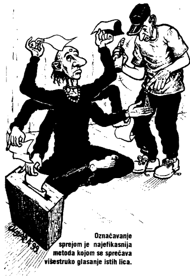
Označavanje sprejom je najefikasnija metoda kojom se sprečava višestruko glasanje istih lica.

prijemu listića za glasanje, ruka mu se premazuje sprejom. U pitanju je specijalni, golim okom nevidljivi sprej, bez mirisa, koji ne oštećuje kožu ali koji u prvih 24 časa nije moguće sprati. Ova tehnologija do sada nije primenijavana u Srbiji, ali nije loše znati o čemu se radi, pošto postoje učestali zahtevi da se i ovde upotrebi takva tehnika.