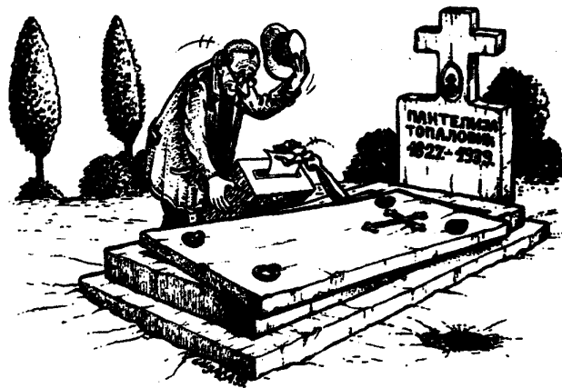
Imena preminulih osoba treba brisati iz biračkog spiska