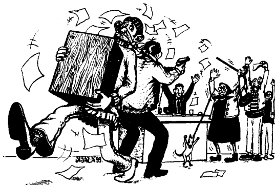
Izborne krađe postoje otkada i izbori. Svaki nedozvoljeni uticaj na rezultat izbora smatra se izbornom krađom.

moguće ukupni broj glasova u izbornoj jedinici za (na tom biračkom mestu) pobedničku listu, smanjiti za nekoliko stotina, što je veoma mnogo. Treba samo unapred znati da će rezultati biti loši i - napraviti neki prekršaj. Na primer, dovoljno je da jedan glasač ubaci umesto jednog više glasačkih listića koje je prethodno dobio u svojim stranačkim prostorijama. U tom slučaju, u kutiji se javlja višak listića, što po automatizmu, "obara" glasanje na tom mestu.