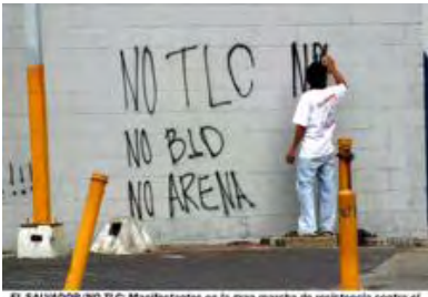
EL SALVADOR/NO TLC: Manifestantes en la gran marcha de resistencia contra el Tratado de Libre Comercio con EE.UU.

Un día antes de que entre en vigor el TLC entre El Salvador y Estados Unidos, trabajadores, sindicalistas, estudiantes y el gran sector informal, marcharon en la capital salvadoreña para concentrarse en la Plaza Libertador y exigir ¡“NO AL TLC”! Esta plaza fue elegida para conmemorar la masacre realizada por el ejército el 28 de febrero 1977.