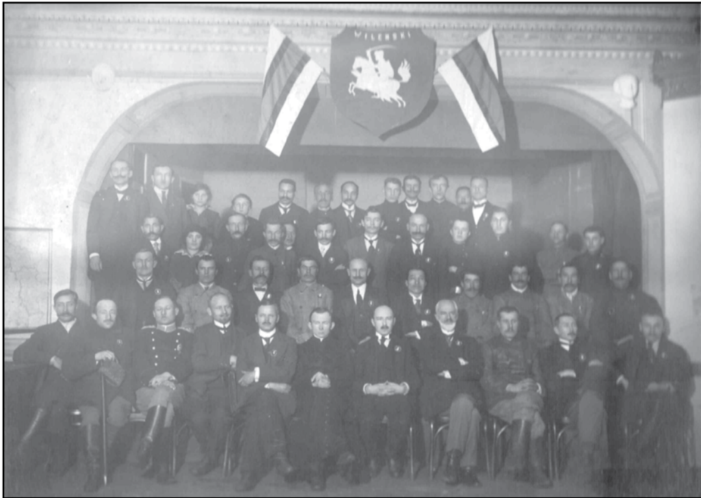
Віленская Беларуская Канферэнцыя. Студзень 1918 г.

І ўсё ж беларускія секцыі працягвалі сваю працу. Акрамя Петраграда і Масквы, яны былі створаны, прынамсі, у Варонежы, Казані, Казлове, Невелі, Саратаве і Тамбове.