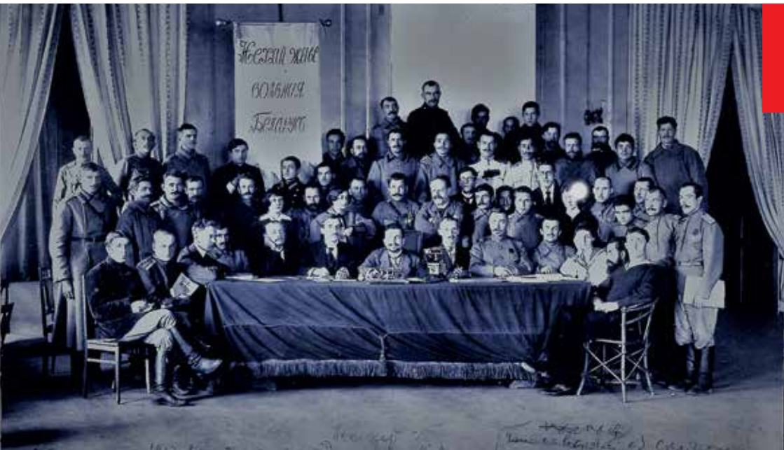
Вялікая Беларуская Рада. Кастрычнік 1917 г.