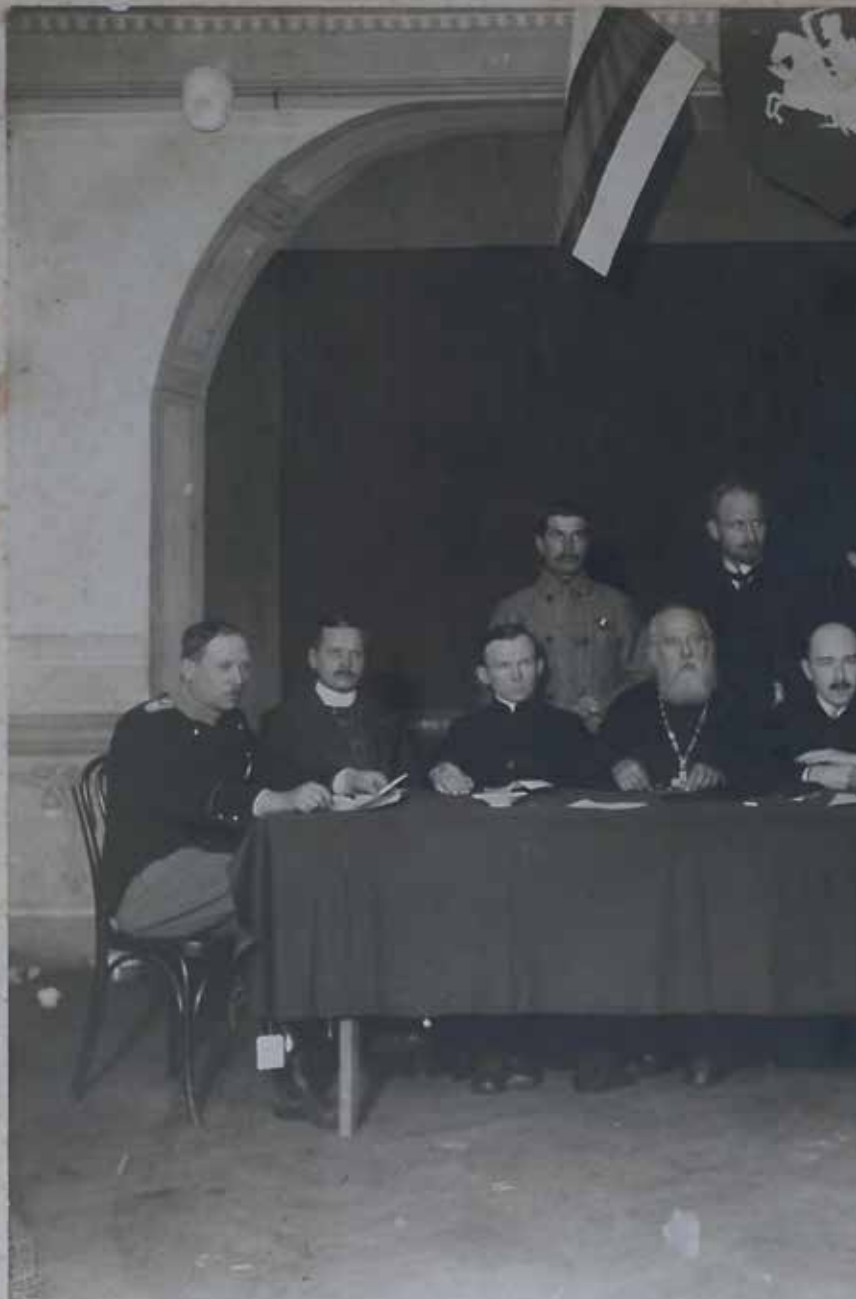
Беларуская Рада ў Вільні. Студзень 1918 г.