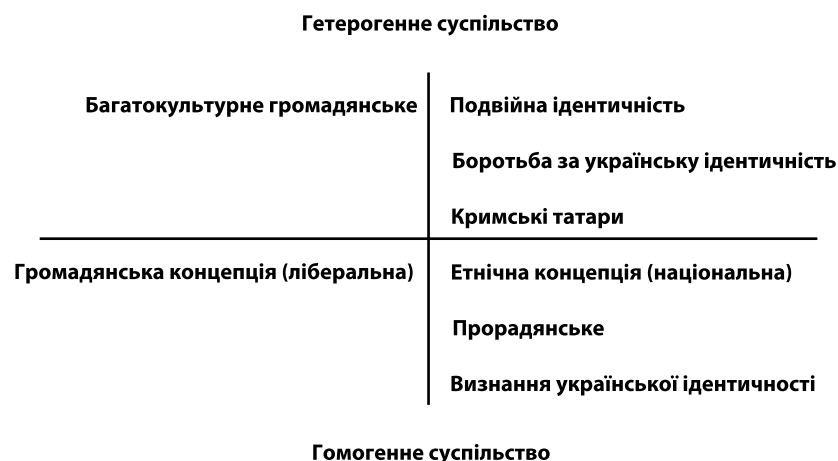
Діаграма 1. Схема викладених моделей

Основні відмінності спостерігаються між моделлю «подвійна ідентичність» та двома українськими моделями. У моделі «подвійна ідентичність» Голодомор вважається результатом класової боротьби, що відбувалася у багатьох частинах СРСР, а у двох українських моделях унікальним геноцидом, скоєним росіянами проти українців. Зменшення кількості людей з російською самосвідомістю інтерпретується у моделі «подвійна ідентичність» як результат тиску та нижчого статусу російській ідентичності, а у двох українських моделях як вільний вибір людей, які мають подвійну ідентичність. Той факт, що російська мова використовується людьми частіше, ніж українська мова інтерпретується як потреба представити права другої мови у моделі «подвійна ідентичність»; та як потреба захищати українську мову у двох українських моделях. Можливість введення російської мови як другої державної мови сприймається як шлях для скорочення конфліктів у моделі «подвійна ідентичність», але у двох українських моделях розглядається як шлях до розділу країни.