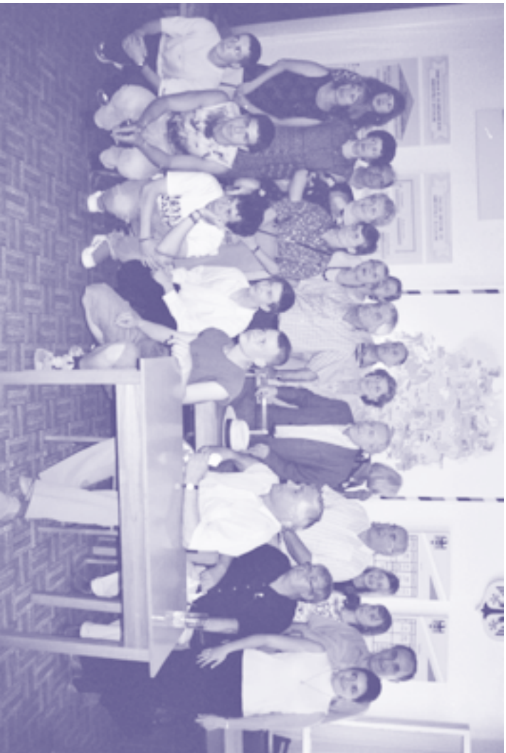
Бесуч einer offiziellen Delegation aus Heidelberg in einer Partnerschule in Simferopol, Mai 2003. Офіційна делегація з Гайдельберга в партнерській школі в Сімферополі (травень 2003р. ).