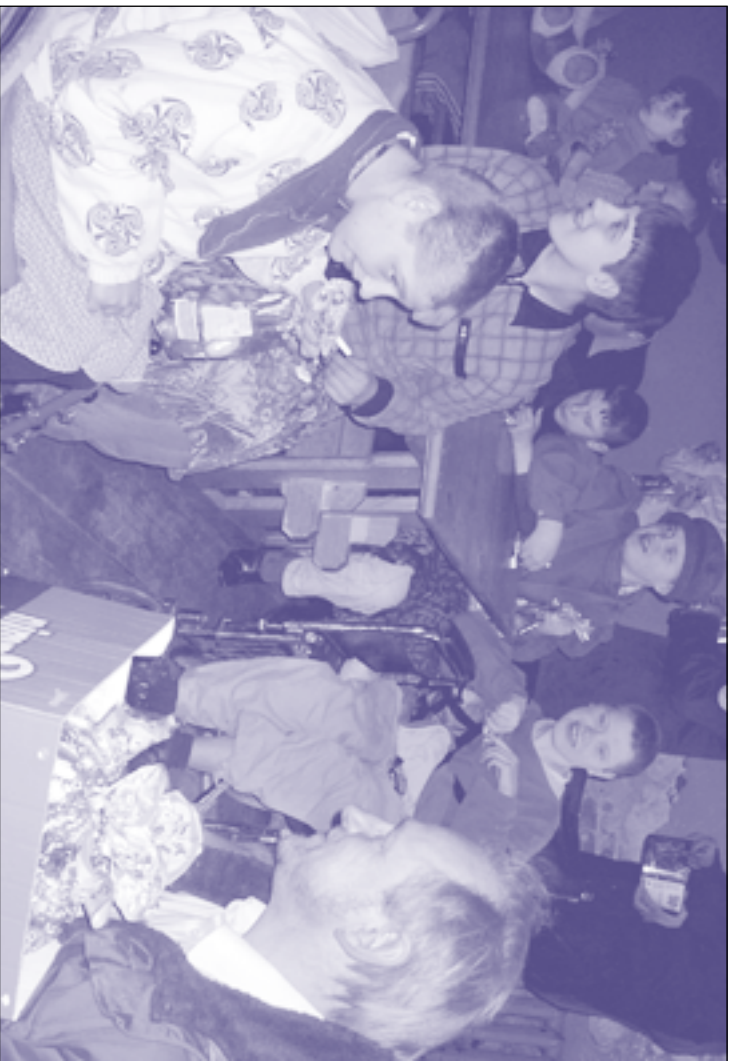
Humanitäre Hilfe für Waisenhaus. Гуманітарна допомога для сирітського будинку.