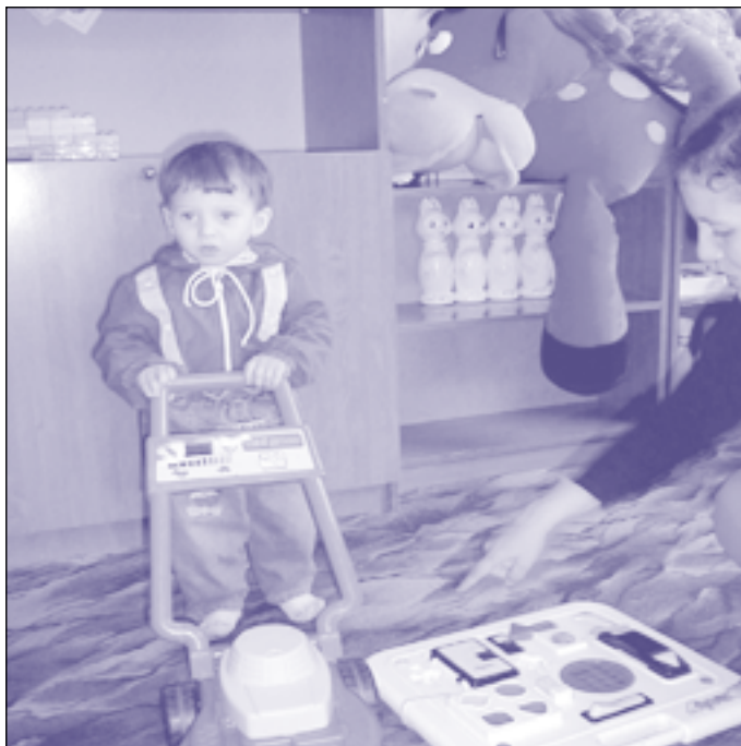
Kindertageszentrum. Центр денного перебування.