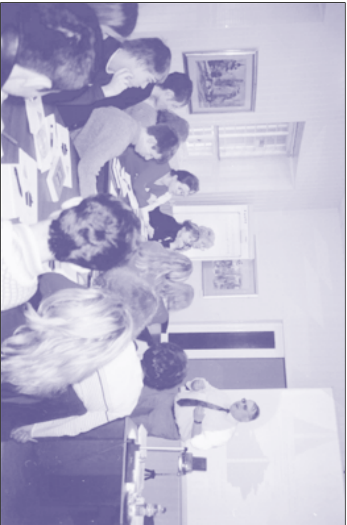
Wirtschaftsseminar «Reformen in Deutschland». Семінар з економіки «Реформи в Німеччині».