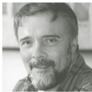
Der Schriftsteller und Historiker György Dalos spricht heute Abend zum Thema Ungarn in Europa.

Es ist auch der Besuch einzelner Veranstaltungen möglich. sahe