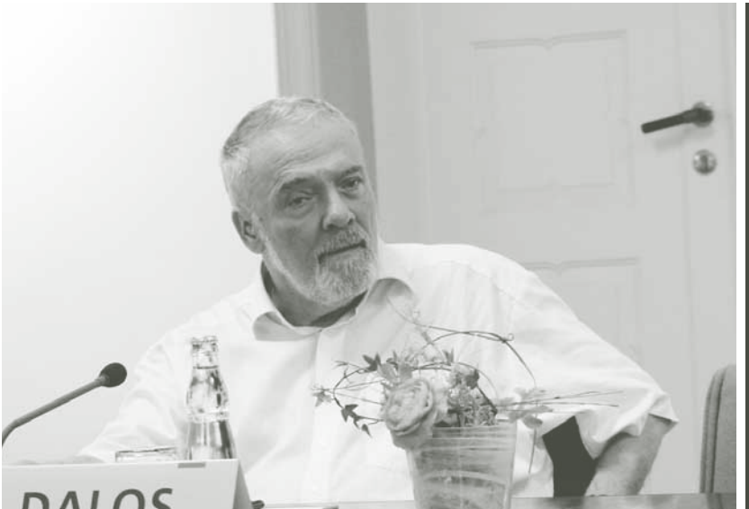
György Dalos

Aber diese Euphorie war trotzdem sehr stark und heute werde ich oft gefragt, ob das Volk oder besser die Gesellschaft, die damals die Grenze öffnete, noch dieselbe ist, die dann 2014 einen 175 km langen Zaun an der ungarisch-serbischen Grenze bauen ließ. Ich sage immer, es ist dieselbe und nicht dieselbe. Selbstverständlich sind wir das Volk der Grenzöffner und obwohl ich bestimmte Begriffe wie ‚Nationalstolz‘ mit viel Vorsicht benutze – ich glaube, Nationalstolz ist so etwas wie Blutdruck, er ist manchmal zu hoch und manchmal zu niedrig und es ist immer schwer, ihn im Rahmen zu halten – war das so ein Moment, wo wir sagten, wir haben es geschafft. Das war ’89 und dann kamen diese zweieinhalb Jahrzehnte, wo die ungarische Gesellschaft begann, ich würde sagen, die Demokratie zu lernen, so wie ein Kind in einen allzu großen Schuh hineinwächst. Diese Demokratie war die westliche Demokratie. Die Institutionen konnten im Nu geschaffen werden, die Spielregeln konnten in einer Verfassung an einem Abend ausgearbeitet werden, aber der Geist dieser Demokratie... - das war schwierig zu erfassen.