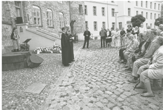
Stilles Gedenken vor dem Krummen Haus.