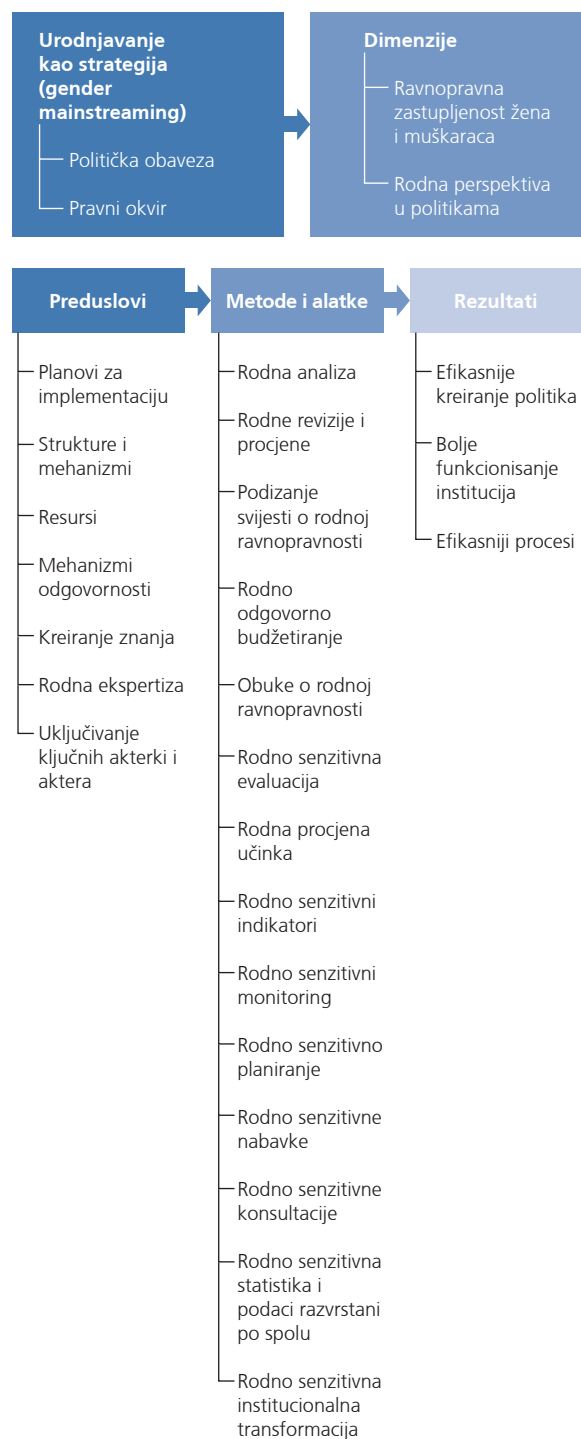
Grafikon 1 Proces urodnjavanja