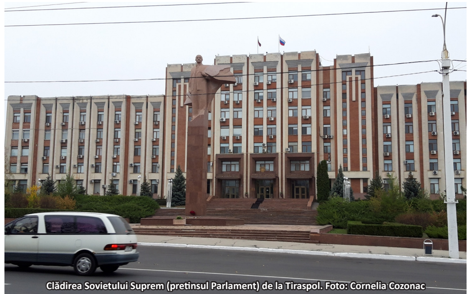
Clădirea Sovietului Suprem (pretinsul Parlament) de la Tiraspol.

Republica Moldova se află în fața unor momente istorice pe care va trebui să le gestioneze cu grijă, dar în același timp și curajos. Pentru Republica Moldova nu este deschisă numai o fereastră de oportunitate fără precedent în privința aderării la UE, dar și una