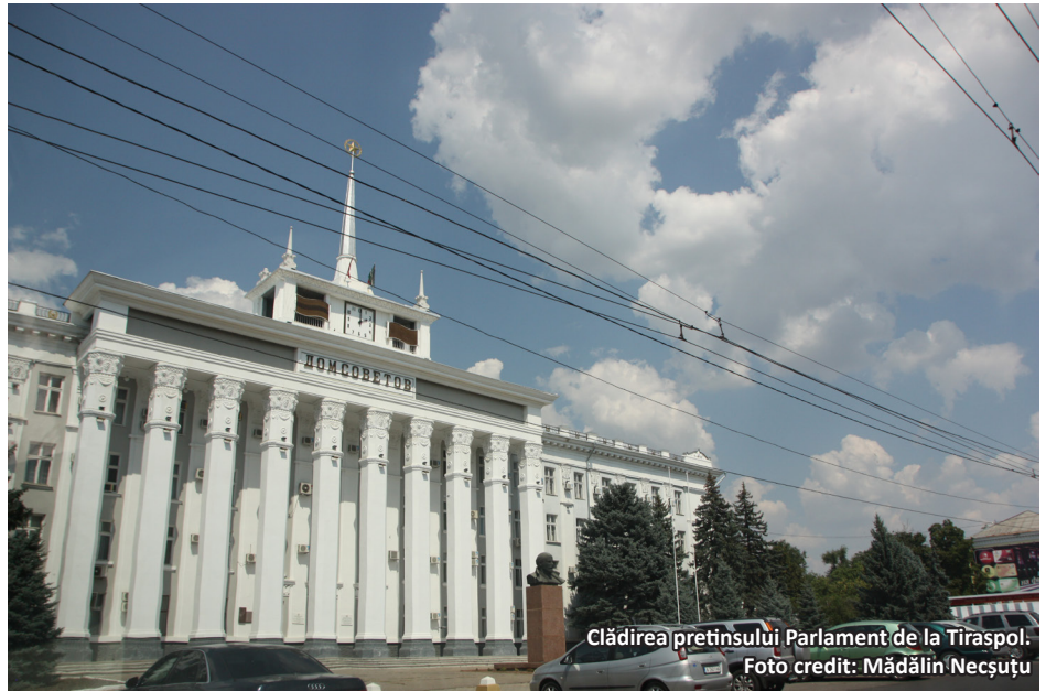
Clădirea pretinsului Parlament de la Tiraspol.

S-a discutat mult despre care ar trebui să fie traseul Republicii Moldova în UE -cu sau fără regiunea separatistă transnistreană până în 2030, atunci când autoritățile Republicii Moldova și-au propus să atingă dezideratul integrării în UE.