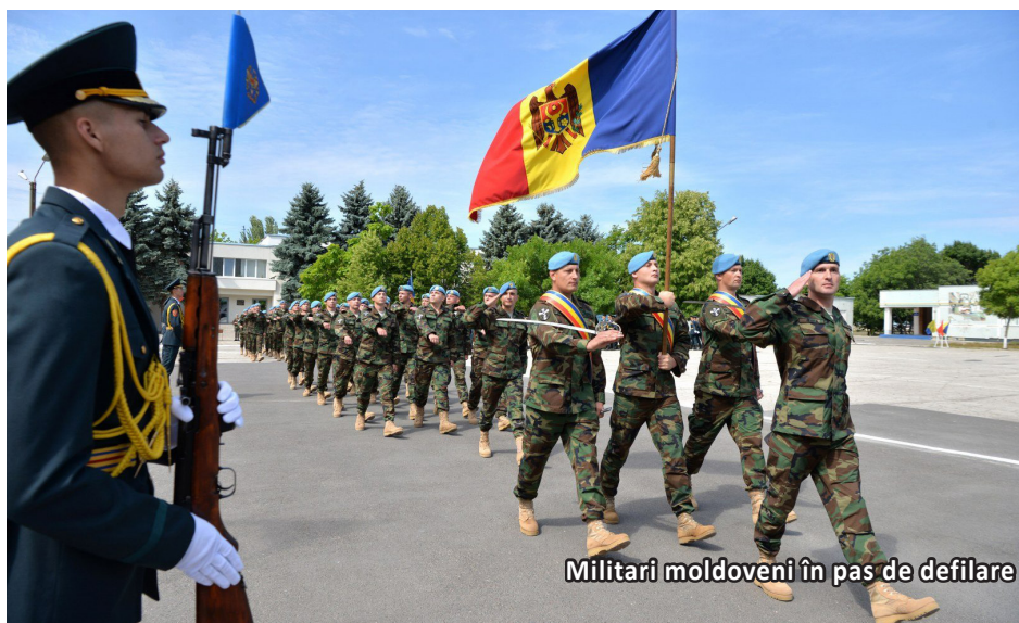
Militari moldoveni în pas de defilare

Invazia Rusiei în Ucraina a schimbat paradigma de abordare a apărării naționale pentru mai multe țări din proximitatea Ucrainei, inclusiv Republica Moldova. Pradă a nepăsării politice și a lipsei de viziune, armata națională a Republicii Moldova s-a degradat treptat și sigur în cei circa 30 de ani de existență.