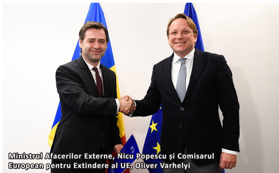
Ministerul Afacerilor Externe, Nicu Popescu și Comisarul European pentru Extindere al UE, Oliver Varhelyi

După completarea a două rânduri de chestionare din partea Comisiei Europene, Republica Moldova se află în fața celui mai important test din acest drum spre Uniunea Europeană care de altfel este doar la început – să primească statutul de țară candidată la UE.