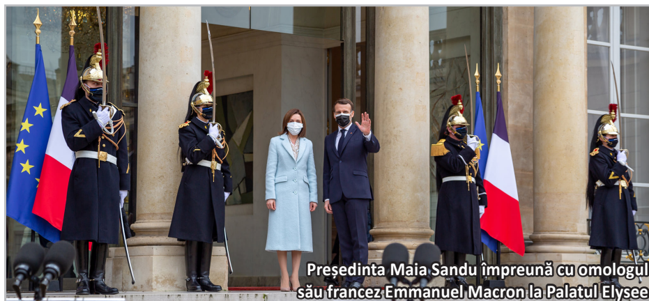
Președinta Maia Sandu împreună cu omologul său francez Emmanuel Macron la Palatul Elysee

Întrevederile noului președinte al Republicii Moldova, Maia Sandu, cu vecinii și unii dintre cei mai importanți parteneri de dezvoltare ai țării au dat rapid roade. Schimbarea de paradigmă și dezghețarea relațiilor cu aceștia a produs efecte imediate și a deblocat fonduri și noi oportunități de dezvoltare în relațiile Moldovei cu România, Ucraina, Uniunea Europeană și Franța.