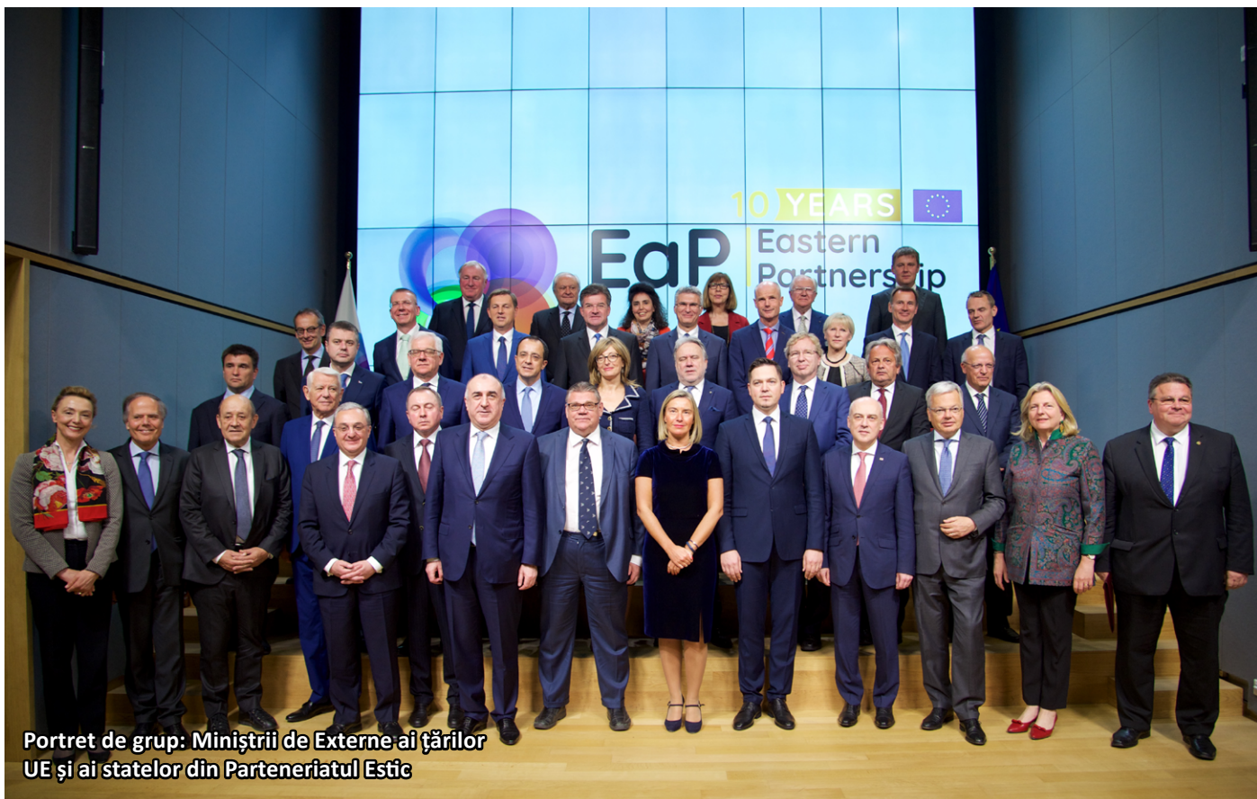
Portret de grup: Miniștrii de Externe ai țărilor UE și ai statelor din Parteneriatul Estic

► exemplar și poveste de succes, au devenit exemplu de... cum nu este bine să... Iar altele - pentru că podiumul nu rămâne niciodată gol - au înlocuit rapid campioana, astfel încât astăzi UE privește cu mult mai mult optimism și încredere la îndepărtata (în termeni geografici) Georgia, decât la Republica Moldova, chiar dacă aceasta din urmă are și frontieră cu Uniunea Europeană.