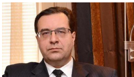
Marian Lupu, șeful grupului parlamentar al Partidului Democrat

Pentru prima dată, regiunea transnistreană va avea deputații ei în Parlamentul de la Chișinău