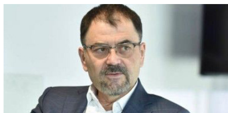
Anatol Șalaru, președinte al Partidului Unității Naționale