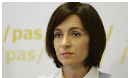
Maia Sandu, președintă a Partidului Acțiune și Solidaritate

■ Maia Sandu: Condiționalități au existat întotdeauna, doar că au fost diferite domeniile pe care le acoperă aceste condiționalități. Dacă vorbim despre Fondul Monetar, care dă undă verde pentru mai mulți finanțatori, FMI a venit întotdeauna cu condiții economice.