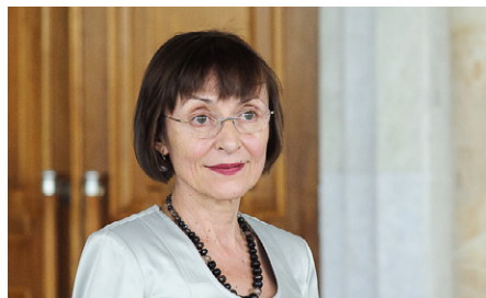
Corina Fusu Vicepreședintă a Partidului Liberal

■ Corina Fusu: Condiționalitatea în acordarea finanțării este bună, bineînțeles, pentru că nu poți să primești atâția bani ani la rând fără să-ți asumi reformele care sunt în beneficiul cetățenilor. Folosirea banilor europeni nerațional, în multe cazuri, trebuie să ia sfârșit. Banul trebuie să ajungă la cetățean și nu pe o sumedenie de experți, documente, legislație, strategii elaborate pe bani enormi europeni, pentru ca apoi aceste strategii să stea în sertare ani de zile și să nu fie implementate.