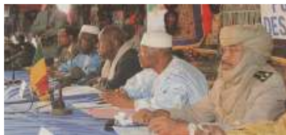
Präsident ATT beim Forum von Kidal 2007

Die Umsetzung des „Pacte National“ stieß auf neue Widerstände, welche erst mit dem Friedensabkommen von 1995 endeten. Als Symbol eines friedlichen Zusammenlebens, wurden im Rahmen der ‚Flamme de la Paix de Tombouctou‘ im März 1996 über 3.000 Waffen symbolisch vernichtet.