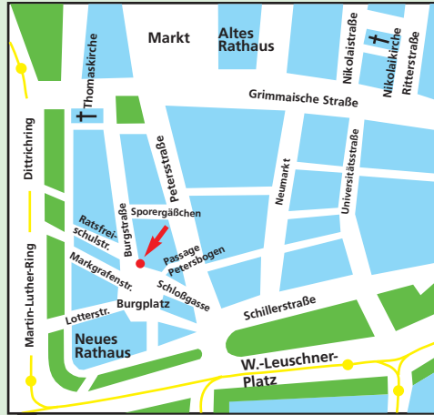
Lageplan Büro Leipzig

Friedrich-Ebert-Stiftung Regionalbüro Leipzig Burgstraße 25 04109 Leipzig Tel: 0341/9 60 21 60 / 9 60 24 31 Fax: 0341/960 50 91 E-Mail: Lpzmail@fes.de Internet: www.fes.de