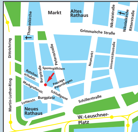
Lageplan Büro Leipzig

Friedrich-Ebert-Stiftung Regionalbüro Leipzig Burgstraße 25 04109 Leipzig Tel: 0341/9 60 21 60 / 9 60 24 31 Fax: 0341/960 50 91 E-Mail: Lpzmail@fes.de Internet: www.fes.de