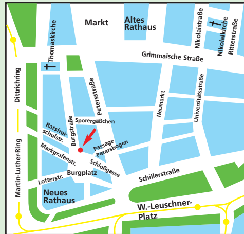
Lageplan Büro Leipzig

Friedrich-Ebert-Stiftung Regionalbüro Leipzig Burgstraße 25 04109 Leipzig Tel: 0341/9 60 21 60 / 9 60 24 31 Fax: 0341/960 50 91 E-Mail: Lpzmail@fes.de Internet: www.fes.de