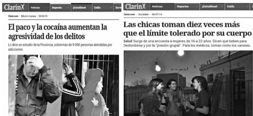
Epígrafe. Ejemplo de los paradigmas en los que se sostienen las narrativas mediáticas en torno a la relación jóvenes y drogas. Clarín es uno de los principales diarios argentinos.

Es en este sentido que la producción de conocimiento científica y académica debe estar comprometida con el desarrollo de trabajos que amplíen o potencien los resultados a los que invita este tercer paradigma de las drogas, teniendo en cuenta que el eje ya no pueden ser las sustancias, o las prácticas profesionales de rehabilitación, sino –y sobre todo- el centro de las miradas tiene que corresponderse con los jóvenes consumidores y ya no como joven-problema, sino como sujetos de derecho. Es decir, las investigaciones que apuesten a contribuir con soluciones reales asisten al desafío de escuchar a los jóvenes, trabajar con ellos en el territorio, interactuar con las organizaciones barriales; y desde allí, elaborar propuestas que aporten al diseño de políticas públicas.