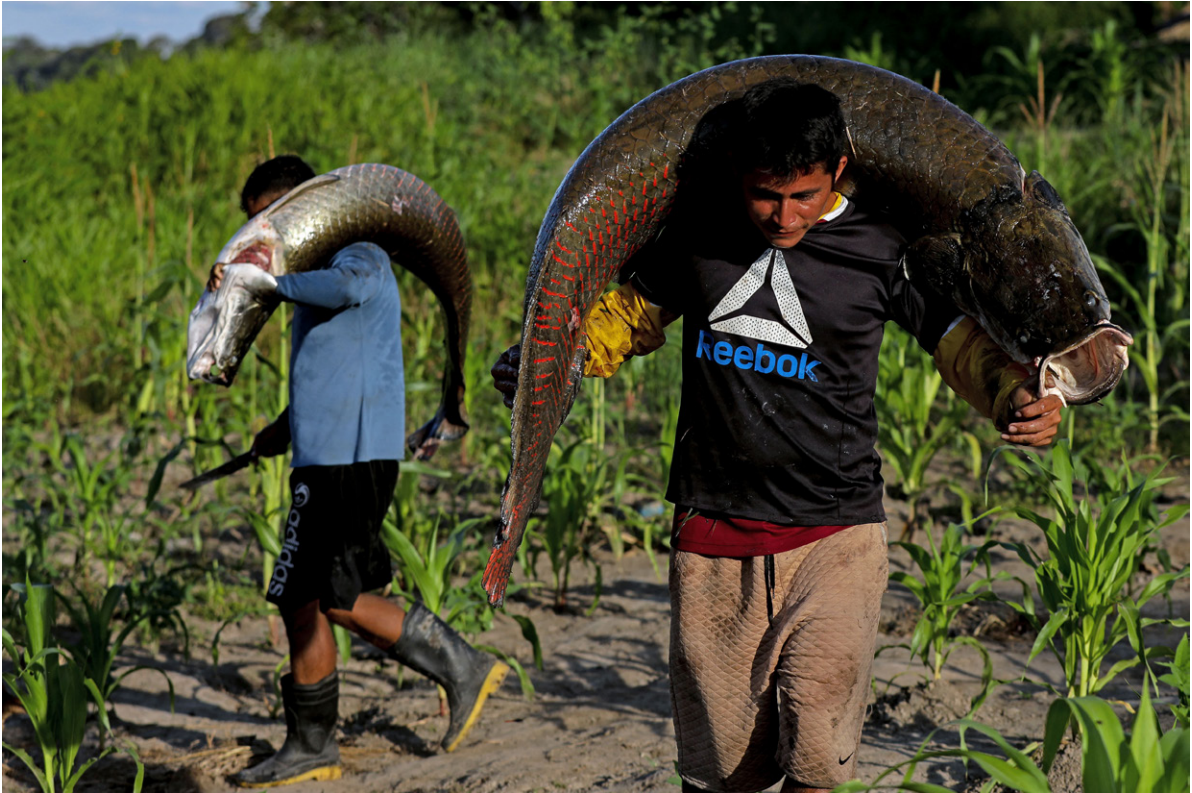
La pesca y la caza ilegales, incluida la caza furtiva del pirarucú, son actividades clave de la economía ilícita trifronteriza y los grupos criminales de la zona están profundamente implicados.

Los pirarucús que se pescan ilegalmente en territorios indígenas del lado brasileño de la triple frontera también se transportan a través de Leticia y Tabatinga para venderlos en Colombia. 103 Dado que Brasil cuenta con las únicas zonas de conservación en las que se crían estos peces, la legislación colombiana permite la importación legal de pirarucú. 104 Sin embargo, la normativa no incluye controles para determinar si las importaciones proceden de fuentes legales, lo que facilita la implicación de actores criminales. 105 Los criminales también transportan cadáveres de animales disecados desde el Valle del Yavarí a través de Tabatinga y Leticia hasta puertos colombianos para exportarlos a mercados asiáticos y norteamericanos. 106