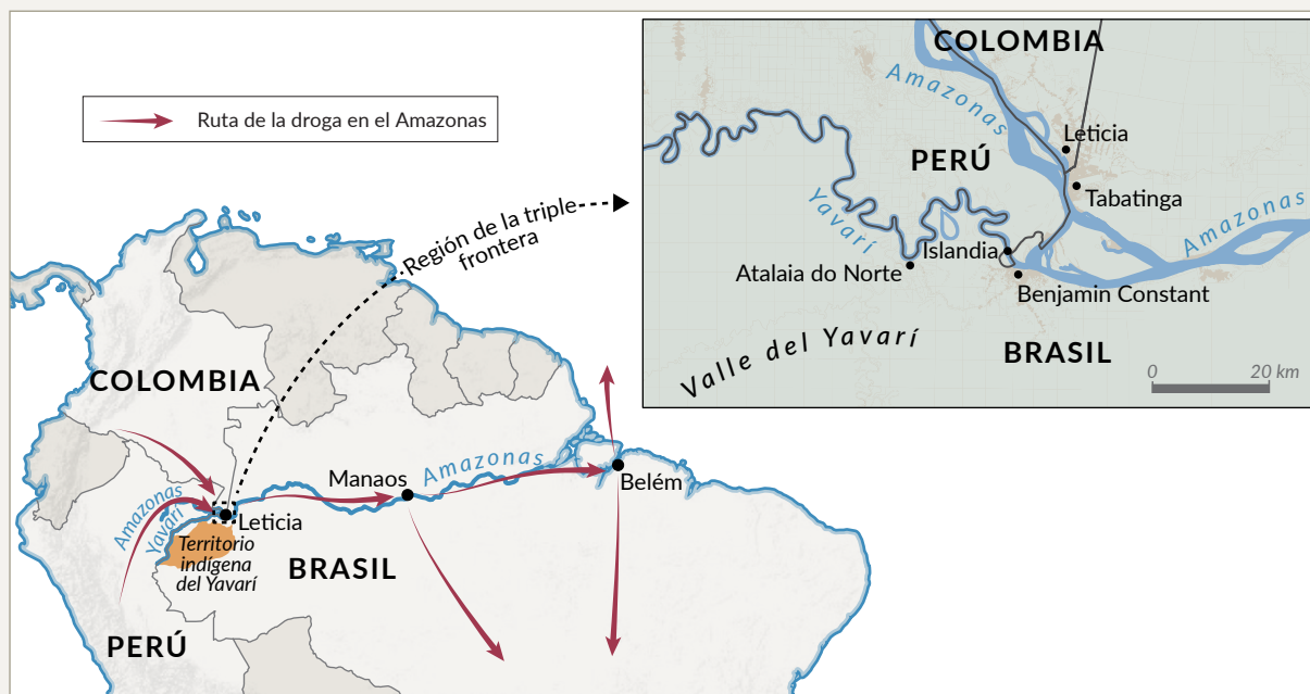
FIGURA 1 Leticia y Tabatinga son los principales ejes comerciales y centros de población en la zona de la triple frontera entre Perú, Colombia y Brasil, y ofrecen acceso directo a Manaus, un nodo clave de la ruta de la droga en el Amazonas.

Manaos, a mil kilómetros de distancia. En julio del 2024, el precio de la cocaína pura en Leticia y Tabatinga era de aproximadamente entre 1 000 y 2 000 USD por kilogramo. Cuando llegaba a Manaus, valía entre 8 000 y 10 000 USD. 15 Los cargamentos de droga procedentes de las ciudades gemelas se envían río abajo desde Manaus para su posterior venta por todo Brasil, país que constituye el segundo mercado consumidor de cocaína más grande del mundo. Otros cargamentos viajan de Manaus a Europa en embarcaciones oceánicas. 16