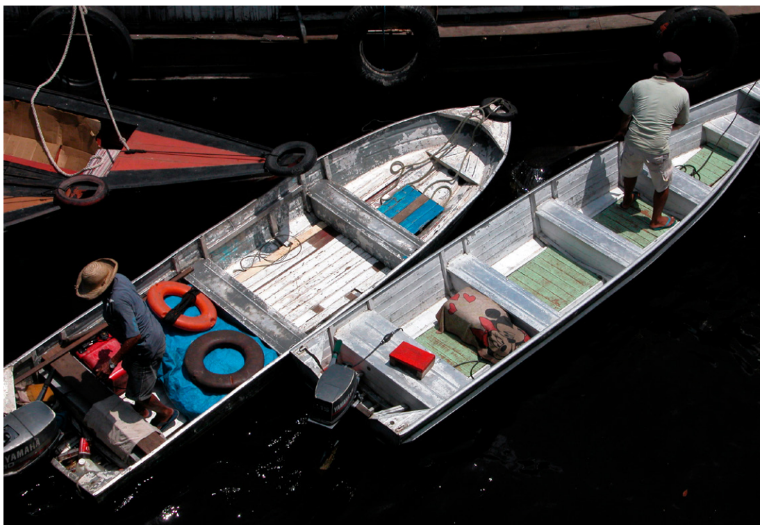
Barcos de pesca en Manaus. Los narcotraficantes utilizan pequeñas embarcaciones como estas para trasladar cargamentos por la ruta de la droga en el Amazonas.

las embarcaciones podían parar para repostar y los traficantes podían coordinarse entre sí y abastecerse de suministros de camino a Manaus.