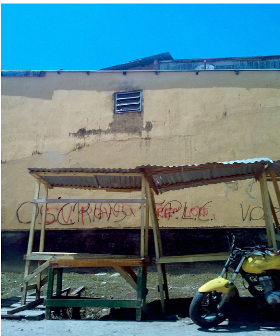
Borrando a la competencia: el grafiti de la pandilla Os Crias cubre el del Comando Vermelho en Tabatinga.