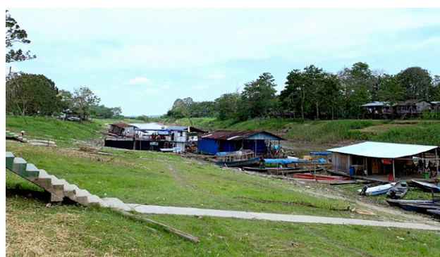
Las zonas ribereñas de Tabatinga (izquierda) y Leticia (derecha).

La llegada de traficantes vinculados con el PCC y el CV a la región de la triple frontera también generó un aumento en el envío de drogas a través del río Amazonas y sus afluentes. 42 Los narcotraficantes empezaron a reclutar hombres jóvenes de las dos ciudades para trabajar como mulas de droga. 43 Estos mensajeros viajan en transbordadores fluviales o en los vuelos diarios de Tabatinga a Manaus, cada uno de ellos cargado con pequeñas cantidades (normalmente entre 5 y 10 kilogramos) de cocaína o cannabis. 44 Las organizaciones criminales también empezaron a contratar grandes barcos pesqueros para transportar cientos de kilos de droga de Tabatinga a Manaus. 45 También transportan cargamentos de pirarucú, el pez de río más grande del mundo, que puede medir tres metros de largo y pesar hasta 200 kilos. La droga se coloca en compartimentos camuflados en el fondo de los barcos, escondida bajo el pescado y una gruesa capa de hielo. 46