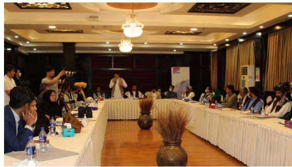
FES, MADPO, APPRO ©

د مدني ټولنې غړيو د ۱۹۹۶ تر ۲۰۰۱ کال پورې د طالبانو د واکمنۍ په یادولو سره په دې اړه اندېښنه وښوده چې کاري بازار ته د ښځو پر لاسرسي او تحرک د بنديزونو لگول او دغه راز له قضایي منصبونو او پستیونو څخه د