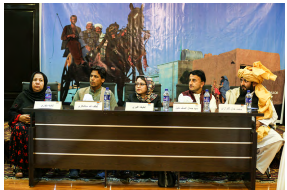
FES, MADPO, APPRO ©

د هر عامل هغه مهم اړخونه په لاندې برخو کې تر بحث لاندې نیول کېږي چې گډونوالو وړاندې کړل: