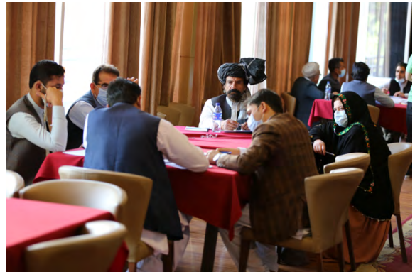
FES, MADPO, APPRO ©

د گروپ غړيو د دې موضوع په اړه ناهيلي وښوده چې د تېرو دوو لسيزو پرمهال، دولت او نړيوال تمویلونکي بریالي نه شول چې د کلیوالي اقتصاد په برخه کې تلپاتې پانگونه وکړي.