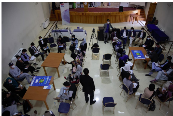
جليل پويا / ORPPA, OPDAM, SEF