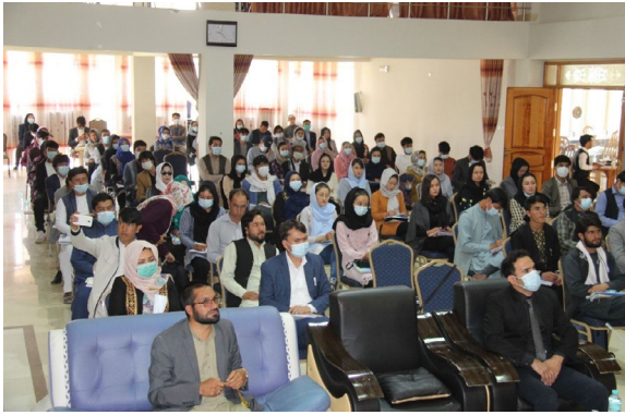
/ APPRO ، MADPO ، FES / جليل پويا

په هره ناستې کې گډون کوونکو ته دنده ورکول کېږي چې په خپلو ټولنو کې هغه مهمې ستونزې چې د جگړو د وضعیت او اغیز د بدلون لامل کېږي، په گوته کړي او بیا په گروپ کې پرې بحث وکړي. په هر گروپ کې، گډون کوونکو د هرې ستونزې لاملونه په گوته کړل، او بیا د دغه لاملونو د حل د لارې چارې په اړه بحث کوي، خو داسې شرایط برابر شې چې اوږدمهاله سوله را منځ ته شي.