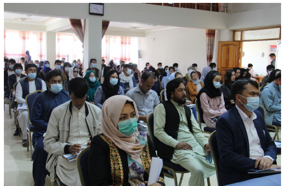
جليل پويا/ FES, MADPO, APPRO

د دندو په تر لاسه كولو كې خپلوې پالل يو بل لامل وه چې د ځوانانو د مايوسي او ناهيلې لامل شوې دي.