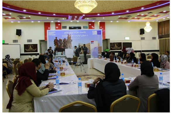
FES، MADPO، APPRO/ هرات د عکس او فليم اخیستلو

یې دغو عواملو ته د محلي او ټولنيزو نوښتونو له لارې رسېدنه وشي.