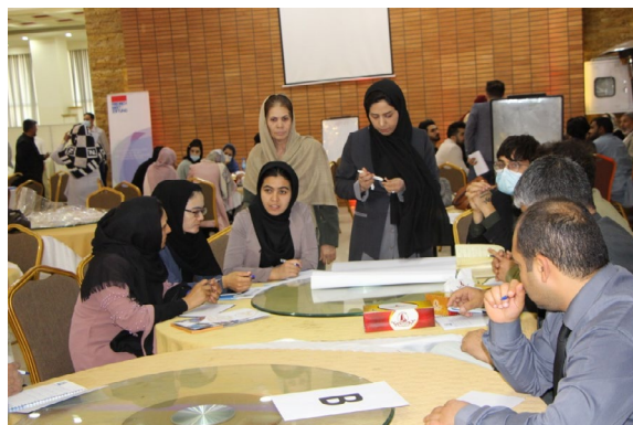
APPRO، MADPO، FES / هرات د عکس او فلم اخیستلو

په هرات او نورو ځایونو کې د سولې لپاره د محلي غونډو یوه لویه ستونزه دا وه چې پناېستان د ځواب ورکولو پرمهال، پر هغو محلي عواملو او فکتورونو خپل تمرکز له لاسه ورنه کړي چې کولای شي د محلي شخړو په هوارولو کې مهم رول ولري. پناېستانو پر هغو ټاکل شویو ټولنیزو مسایلو د تمرکز پرځای چې د ګډونوالو له خوا مطرح شوي وو، تر ډېره تمایل درلود چې پر بهرنیو