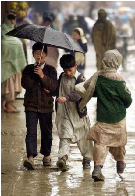
زندگی تر شدن پی در پی ...