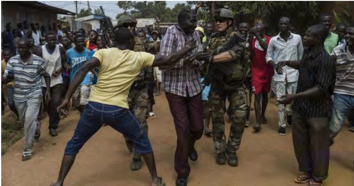
Limo tĪ: mbĕtisango humanité.fr “Bĕafrĭka: Djotodia ahön, käingö kpälĕ nĪ angbâ”, ngû 2013

TĪ hünzi na nĪ, nzara tĪ bê na lĕgĕ tĪ lĕndo-porosö tĪ Farânzi ayeke sô lâkûĕ ayeke na bê tĪ âkötä ködörö mosoro kûĕ, tĪ wara ndo tĪ tene âturûgu tĪ âla alĭngbi tĪ dutĭ da tĪ sâra na âkua tĪ birä. Sô sĭ lo yeke wabûmbi tĪ Bâda Sĕduti tĪ Bĕndo tĪ Gigĭ, Farânzi ayeke kû kĕtĕ pĕpe tĪ dutĭ na gündâ tĪ âmbĕlä tĪ Bĕndo tĪ Gigĭ töngana mbĕlä 2127, ngâ na âkua tĪ âturûgu tĪ Bĕndo tĪ Pötö. Ayeke bĭânĪ mbĕnĪ kodĕkĕma tĪ vüngängö sango, sô na lĕgĕ tĪ âkua tĪ âturûgu tĪ lo, lo yĕ tĪ tene âködörö tĪ Bĕ tĪ Afrĭka kûĕ angbâ na gbe tĪ lo. Müngö mabôko tĪ Farânzi ayeke sĕngĕ pĕpe, lĕgĕ ôko ngâ töngana tĪ âmbĕnĪ ködörö.