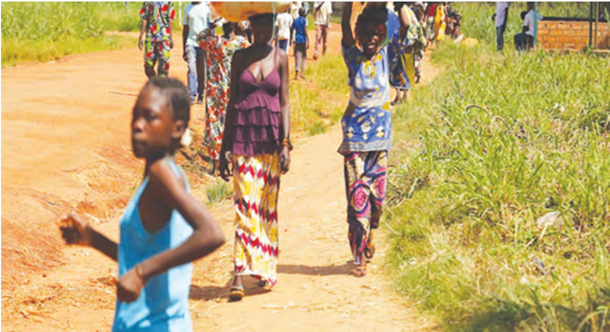
Limo tî: grotius.fr/fängä yê na ndö tî mbai-hînga ndâ tî kpälë tî bêafrîka/ngû 2013

Bangî tî sî na ködörösêse tî Kamerun, sô ayeke lêgë sô âkuamosoro tî Bêafrîka mîngi ayeke tambûla na ndö nî, na sô sî ayeke hön na âkûngbâ tî zângbihalë na ndö nî, akara lo tî kîri na söngö na pöpö tî âwabirä, ngâ pëpe tî kâi âfängö zo na sâlängö mbänä na âzo. Alîngbi ë hînga tâa tënë sô ayeke gi âzo 7000 (âmarä tî âturûgu kûê na yâ nî) tî sâra kua na ndö tî ködörösê sô lê nî ayeke tóngana barâsi 623.000, sô ayeke na birä wala sô birä alöndö tî hünzi na yâ nî, ayeke kêtê mîngi.