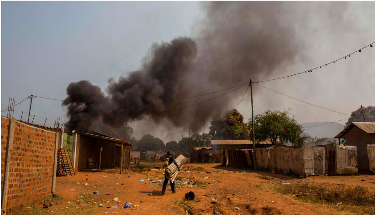
Limo tĪ : Wasëndâ tĪ Ndokua FES, BangĪ, ngŭ 2013