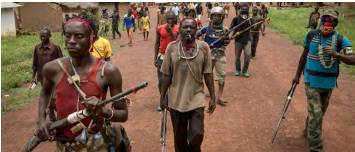
Limo tĭ: mbëtisango “ jeunefrique.com Bêafrika JeuneAfrique.com ngû 2013

Âturûgu tĭ bätängö ködörö na âla tĭ bätängö sêduti ayeke na gündâ tĭ âkpälê tĭ porosö na tĭ särängö sĭönĭ yê na terê tĭ âzo na yâ tĭ ködörö. Mĭngi tĭ âmokönzi tĭ âbûmbi tĭ turûgu kpälê alöndö na pöpö tĭ âturûgu tĭ ködörö nĭ ngâ na pöpö tĭ âwandarä tĭ porosö. Mbênĭ ndâ tĭ tĭngö tĭ Bêafrika na yâ tĭ kötâ wûsûwûsu ayeke bûbängö tĭ ândo kua tĭ bätängö ködörö na tĭ sêduti. Mĭngi nĭ ka âturûgu tĭ ködörö ayeke mä terê na ngurugbiä pëpe ndâli tĭ sô âgbiä tĭ ködörö nĭ ayê tĭ zĭa gĭ âzo tĭ marä tĭ âla na ndö tĭ ayê nĭ tĭ tene âla lü ngangü tĭ gbiä tĭ âla. Lëngögbiä alĭngbi tĭ dutĭ gĭ na ndö tĭ marä? Sĭ tōngana lëngögbiä ayeke bängö ndo na ndö tĭ sëndëndê, sâlängö kua na lëgê sô zo kûê ayê da na nĭ, fadê alĭngbi tĭ mû lëgê tĭ zĭa ngangü tĭ gbiä na yâ tĭ ködörö nĭ kûê pëpe? Âhûnda sô ayeke ngâ fängö lëgê, ayeke sêngê pëpe. Na bängö mäingö tĭ mbai tĭ porosö na tĭ sêduti tĭ Bêafrika, pekô tĭ kua nĭ ayeke yê tĭ gōnda pëpe: Lëngögbiä na ndö tĭ tēnē tĭ marä ayeke nzönĭ pëpe ndâli tĭ halëzo, ngâ ayeke buba päsä tĭ âwalëngögbiä.