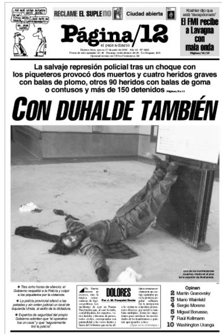
Tapa Página 12, jueves 27 de junio de 2002. http://www.pagina12.com.ar/diario/principal/index-2002-06-27.html