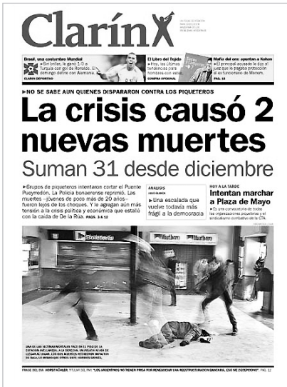
Tapa Diario Clarín, después del día de la masacre, jueves 27 junio 2002.

de marco grueso). Dice que lo leyó en el libro Las grandes fotografías del periodismo argentino que, en muchos tomos, está saliendo ahora en Clarín. Aquella foto de los piqueteros –“la” foto– está hoy junto a otras muchas imágenes, incluídas las de Maradona y Eva Perón.