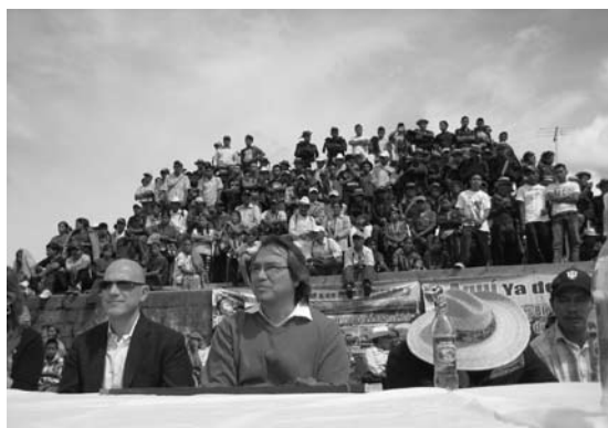
Se puede apreciar al relator en la mesa principal.