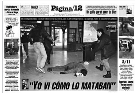
Página 12, Foto del día después viernes 28 de junio de 2002. http://www.pagina12.com.ar/diario/principal/diario/index-2002-06-28.html

Como la réplica de un sismo el movimiento de desocupados estaba llegando desde el interior del país a la casa presidencial. Nació a mediados de los 90. Entonces, la economía crecía, y el desempleo también. Del 7% en 1991 trepó al 21,5% en el 2002 (6). La brecha social se convirtió en la más grande de las últimas