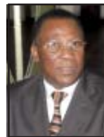
Moïse BOSSOU Président de la Commis- sion des Relations Extérieures et de la Coopération