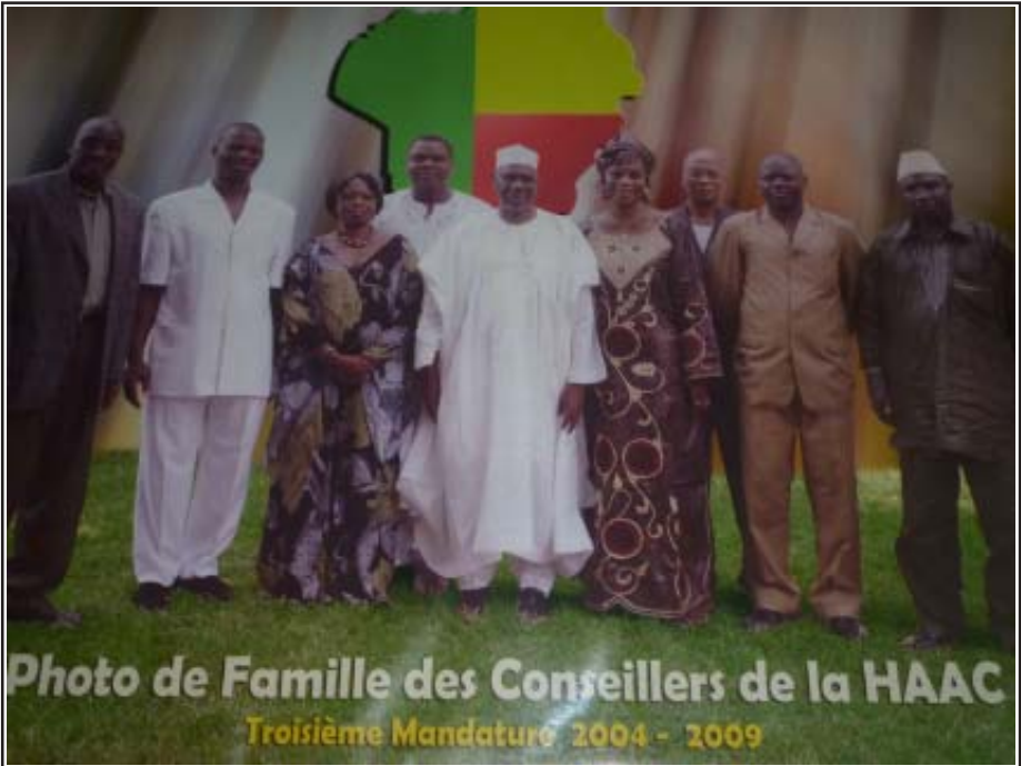
Photo de Famille des Conseillers de la HAAC Troisième Mandature 2004 - 2009