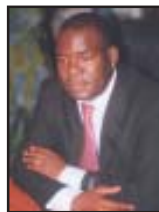
Célestin AKPOVO 2 ème Rapporteur, Prési- dent de la Commission de la Législation et du Contentieux