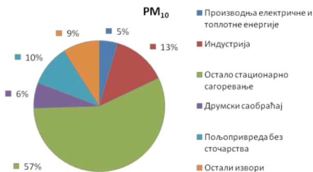
Infografika br. 2 za Srbiju