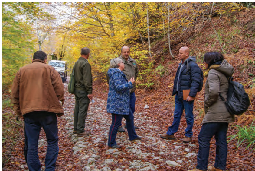
Figura 3. Vizita në terren nga ekipi i punës.