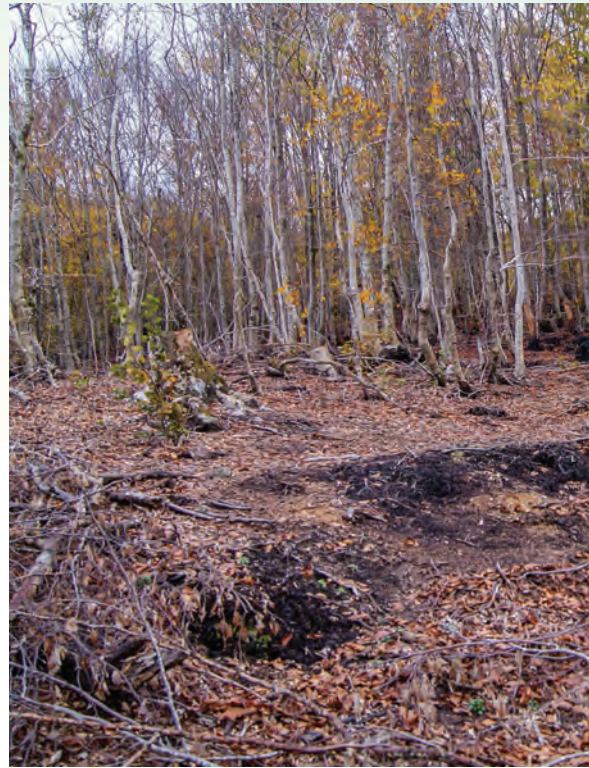
Figura 4. Ngastra nr.58 me dëmtimet e konstatuara në Kostenj.