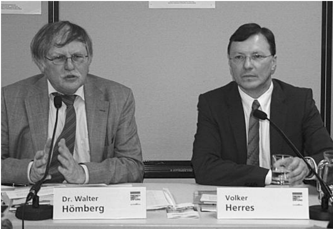
39 Münchner Mediengespräch: Trends im Rundfunk, 1. April 2009. Walter Hömberg und Volker Herres, Programmdirektor des ARD-Gemeinschaftsprogramms Das Erste.

durchaus vorstellen, dass das auch ein wichtiges Experimentierfeld für Journalistik-Studiengänge darstellt. Nicht ohne Grund werden immer häufiger Stimmen laut, die den Öffentlich-Rechtlichen vorwerfen, sich zu Seniorensendern zu entwickeln. Es wäre fatal, wenn eine Art Generationsbruch eintreten würde.