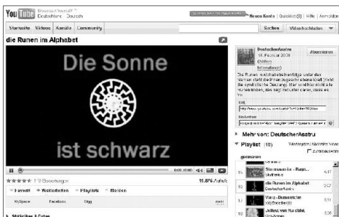
Die Schwarze Sonne bei Youtube

Socken-Zoo eine Zeitlang Dutzende ernsthafter Wikipedianer beschäftigen, bis er enttarnt wird“, fürchtet The Brainstorm .