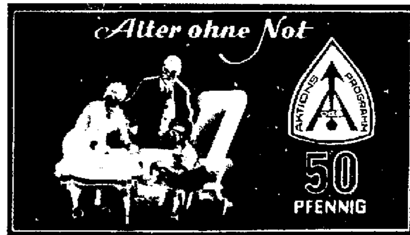
Sondermarke zum Aktionsprogramm

Damit wurde ohne Zweifel eine merkliche Verbesserung der Renten-leistungen erreicht. Das darf aber nicht darüber hinwegtäuschen, daß gerade die Bezieher von Mindestrenten keine ausreichende Sicherung erhalten haben. Die einmalige Aufbesserung der Renten zum 1. Januar 1957 verhindert nicht, daß der tatsächliche Wert der Renten wieder absinken kann. Der DGB forderte deshalb die jährliche Anpassung der Renten an die geänderten Lohn- und Gehaltseinkommen der Arbeitnehmer. Der Forderung nach einer automatischen Rentenanpassung kommt entscheidende Bedeutung zu, weil nur so der Rentner vom Mehrertrag der Wirtschaft laufend einen angemessenen Teil erhält.