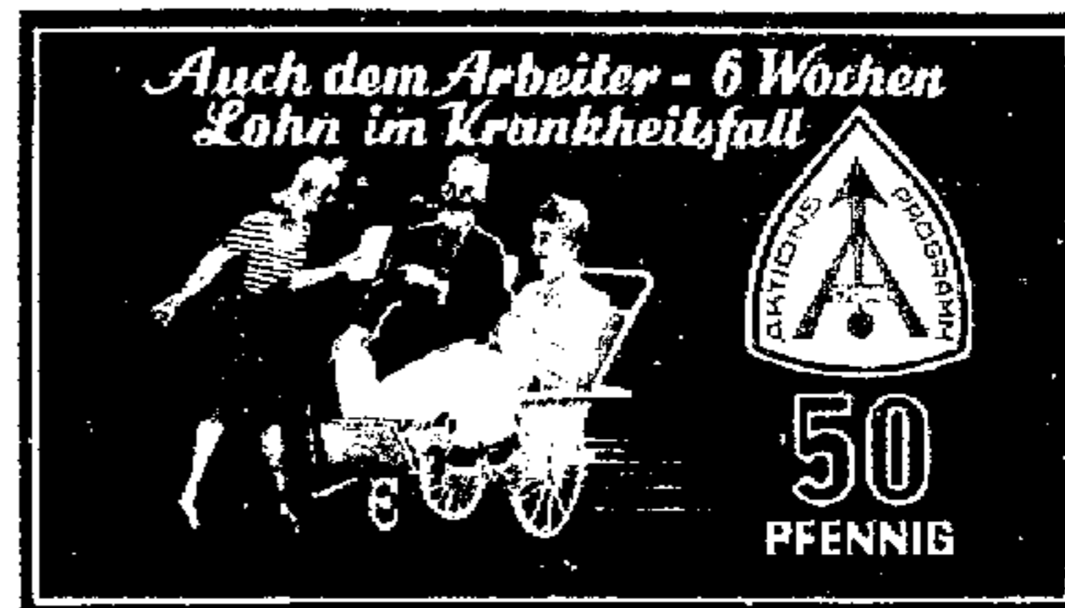
Sondermarke zum Aktionsprogramm

Mit diesem Gesetz wurde ein beachtlicher Schritt auf dem Wege zur Lohnfortzahlung im Krankheitsfalle für die Arbeiter getan. Die volle wirtschaftliche und soziale Sicherung der kranken Arbeiter und ihre notwendige Gleichstellung mit anderen Arbeitnehmergruppen wurde jedoch nicht erreicht. Der DGB hatte bereits im Jahre 1955 den Fraktionen des Deutschen Bundestages einen Gesetzentwurf zur Änderung des § 616 BGB (Fortzahlung des Lohnes bei Krankheit) zugeleitet. Die Mehrheit des Bundestages lehnte es leider ab, ein entsprechendes Gesetz zu verabschieden. Deshalb versuchten die Gewerkschaften, durch Tarifvereinbarungen die Zahlung von Beihilfen zur Überbrückung der Karenztage zu erreichen. Die Gewerkschaft der Eisenbahner Deutschlands konnte beispielsweise die 90prozentige Lohnfortzahlung vom