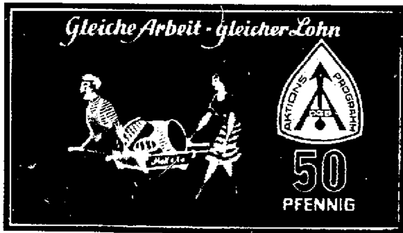
Sondermarke zum Aktionsprogramm

Erhebungen von Meinungsforschungsinstituten ergaben, daß diese großangelegte Werbekampagne ihren Zweck erfüllt hat. Der dadurch erzielte Erfolg bestätigt, wie wichtig und wirksam ein gemeinsames Vorgehen der Gewerkschaften in den entscheidenden Fragen ist.