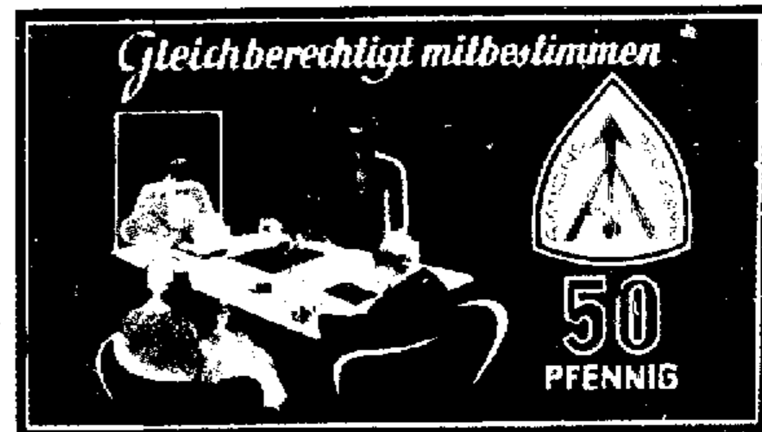
Sondermarke zum Aktionsprogramm

Daneben wurden in zweimaliger Folge von vier Wochen in 420 Lichtspieltheatern Diapositive mit den Werbetexten zu den gewerkschaftlichen Forderungen gezeigt. Auf diese Weise sind schätzungsweise 25 Millionen Kinobesucher mit diesen Forderungen bekanntgemacht worden. Außerdem wurden zur Verwendung durch die einzelnen Gewerkschaften 90 Dia-Serien mit Motiven der Sondermarken hergestellt und verteilt. Den Landesbezirken und den Kreis- und Ortsausschüssen des DGB wurden 300 Rollstempel mit Abbildungen der Sondermarken übergeben.