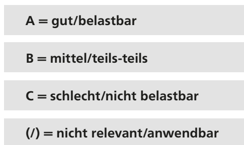
Abbildung 4 Codierung der Quellen-/Datenlage