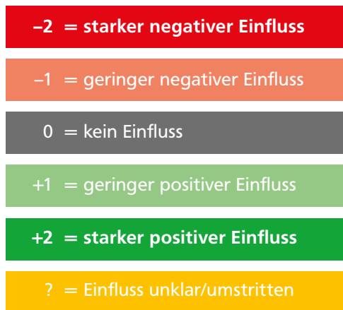
Abbildung 3 ZEIG-Bewertungsskala