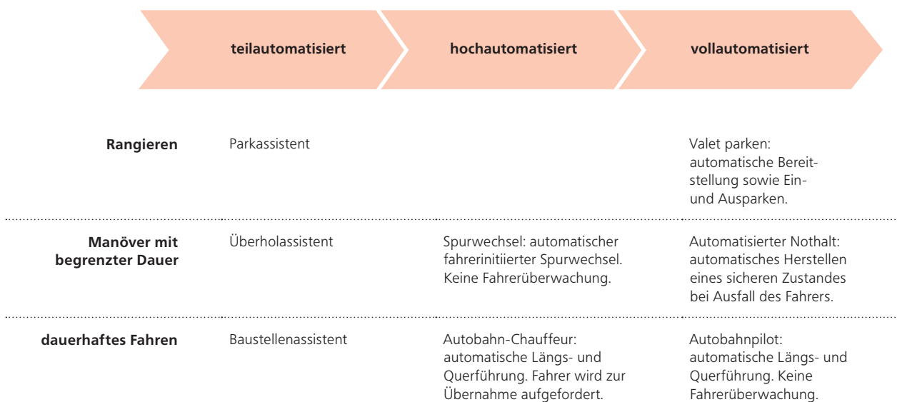
Abbildung 3 Bereits angebotene Automatisierungsfunktionen

Quelle: Eigene Darstellung, nach Lemmer 2014: 13.