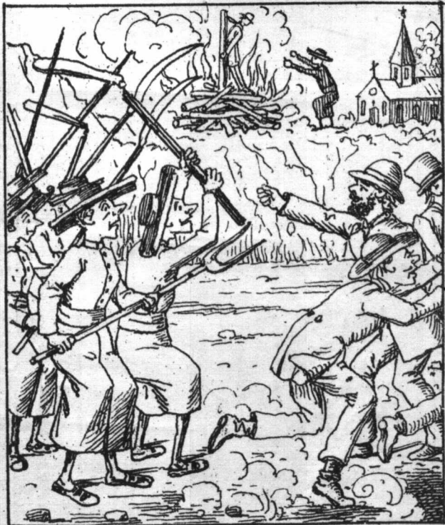
Die geistige Bekämpfung der Socialdemokratie.