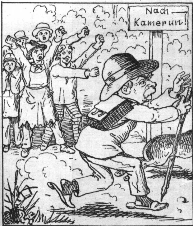
Der 18. März 1889. Entlassung des alten Nörglers.