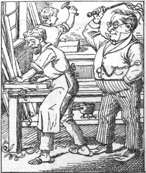
Die neue Fabrik-Ordnung.