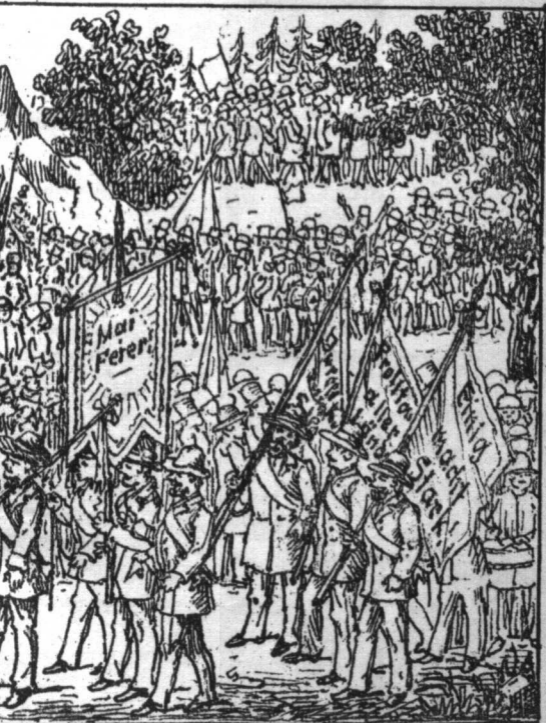
er (Demonstration). Aufzug der Arbeiter.