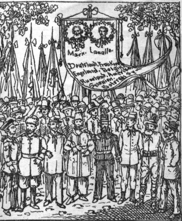
Internationales Verbrüderungsfest. Hoch der Achtstundentag.