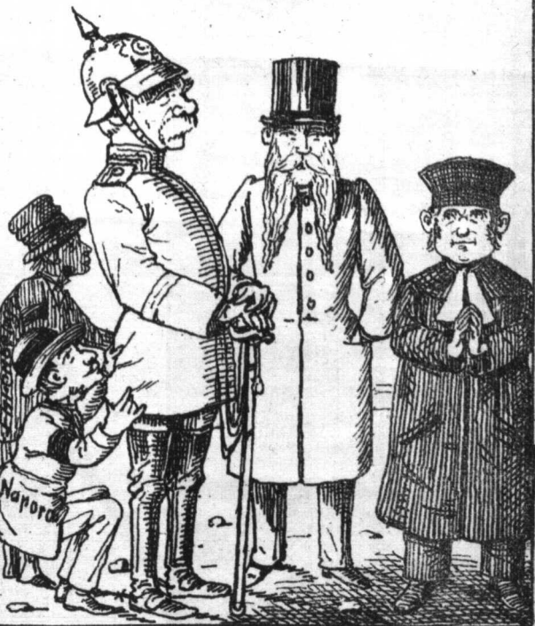
Die Väter des Socialisten-Gesetzes nebst ihren Helfershelfern.