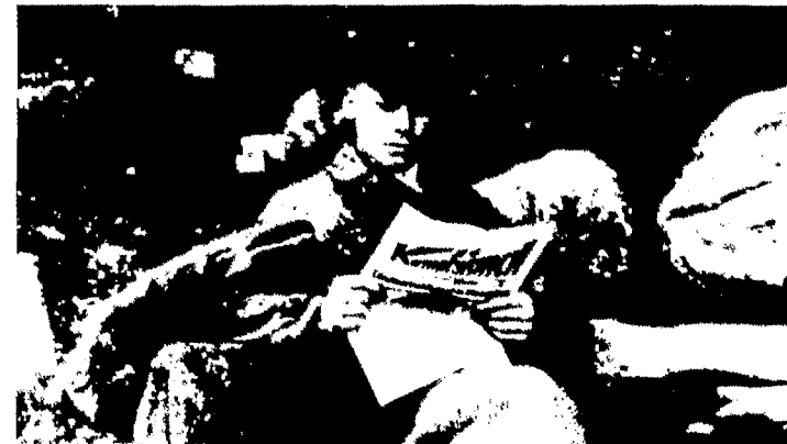
Willy Brandt en su juventud

Estos pocos días, sin embargo, y el enfrentamiento directo con los horrores de la guerra, le han marcado para siempre en su posterior lucha a lo largo de su vida por la paz y la democracia, y por una Europa que ya desde entonces le parece como una meta muy concreta, pero siempre como parte de un orden mundial de entendimiento entre los pueblos.