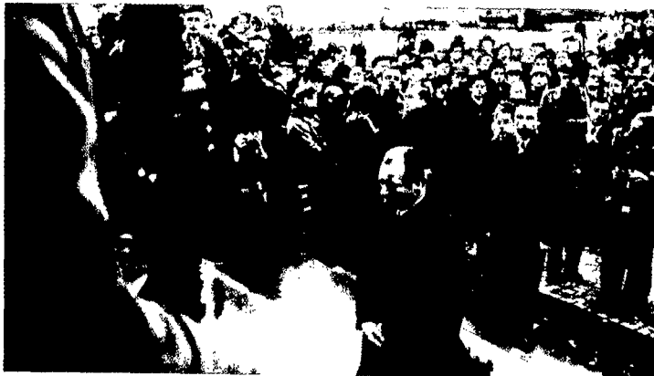
1970. En el Gueto de Varsovia

El tablero número 6 refleja el regreso de Willy Brandt a Alemania después de la guerra donde fija su domicilio en Berlín. A partir de entonces comienza su carrera política que le lleva a ser diputado federal y regional. A partir de 1957 hasta 1966 ocupa, en medio de la Guerra Fría, el cargo de Alcalde-Gobernante de Berlín, lo que corresponde a la Presidencia de un gobierno regional.