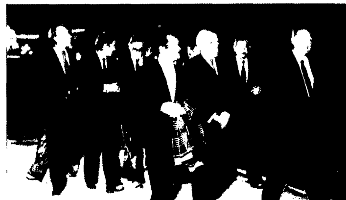
1980. Encuentro con el Alcalde de Madrid Enrique Tierno

Pero así como nunca dejaste de ser alemán, aunque no figurase en tu pasaporte de juventud, tampoco has dejado de ser, desde entonces, ciudadano europeo; desde aquella primera experiencia,