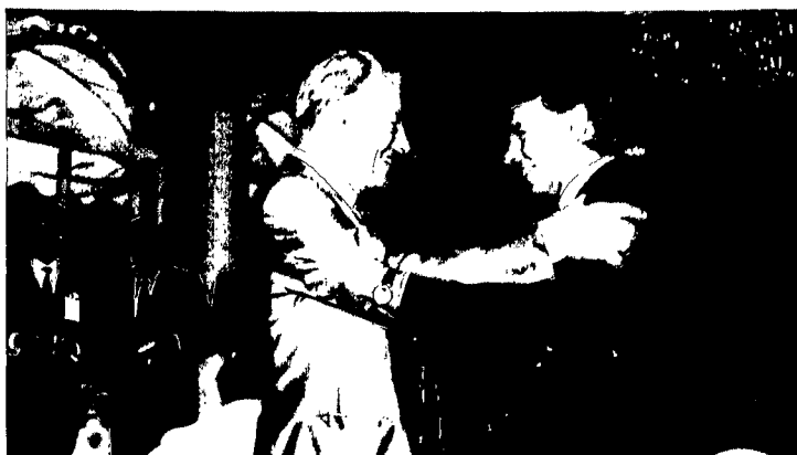
1992. Último encuentro de Willy Brandt con Felipe González

Hace un mes, tras la clausura, en esta misma sala, del Congreso de la Internacional Socialista, que no pudiste presidir, me acerqué a saludarte. Me preguntaste por algunos aspectos del Congreso y, cuando por tercera vez te dije que todo había ido bien, con una sonrisa serena, observaste: "parece que las cosas van mejor sin mí".