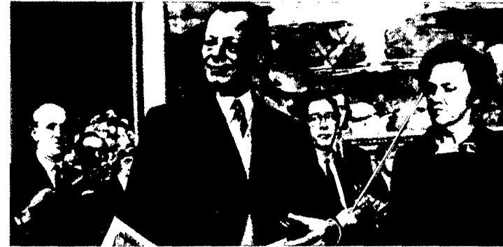
1971. Recibe el Premio Nóbel de la Paz en Oslo