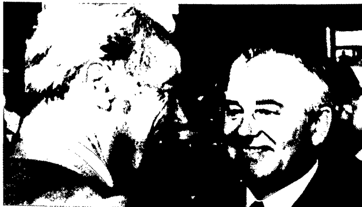
1990. Encuentro de Willy Brandt con Mijail Gorbachov

Yo he visto una chispa de alegría en tus ojos cuando oías una idea nueva, fresca, sugerente, a la que siempre estabas abierto. Y he visto