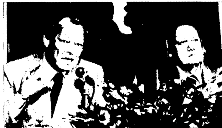
1978. Willy Brandt con Mario Soares en la Conferencia de Lisboa

El fortalecimiento de las Naciones Unidas ha sido uno de nuestros objetivos más antiguos y familiares. Ahora, que se vislumbra un progreso y que a las Naciones Unidas se les confiere, si no más poder, al menos más influencia, merece la pena desplegar un gran esfuerzo. Ayudemos a que se entreguen a las Naciones Unidas los medios que necesitan para que, en efecto, puedan ejercer su influencia.