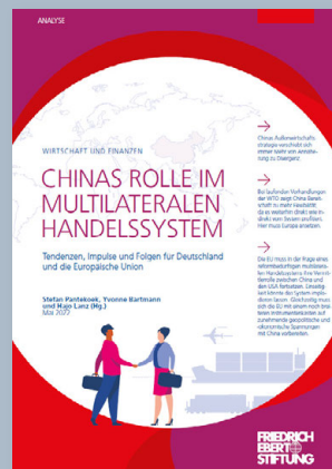
Chinas Rolle im multilateralen Handelssystem Tendenzen, Impulse und Folgen für Deutschland und die Europäische Union Stefan Pantekoek, Yvonne Bartmann und Hajo Lanz (Hrsg.)