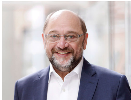
Martin Schulz Vorsitzender der Friedrich-Ebert-Stiftung e.V.

Dank neuer Arbeitsweisen konnten wir daher kurz nach dem russischen Einmarsch in die Ukraine reagieren: Mit der Tiergartenkonferenz, unserem außenpolitischen Flaggschiff-Format, stellten wir das erste große Forum auf die Beine, das Antworten zur Zeitenwende formulierte. Die auf der Konferenz von SPD-Chef Lars Klingbeil geforderte