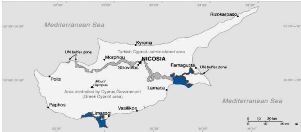
Kıbrıs Haritası (mavi olarak gösterilen yerler, "egemen İngiliz üsleri" olarak adlandırılmaktadır) 2

Türk yönetimi altındadır. Ülkenin güney kısmı ise Kıbrıs Cumhuriyeti'nin kontrolü altındadır ve Kıbrıs Cumhuriyeti 1964'ten itibaren Kıbrıslı Rumlar tarafından yönetilmektedir. İki kısım (haritada gri olarak gösterilen) "Yeşil Hat" olarak bilinen bir ara bölgeyle ayrılmaktadır ve bu bölge BM kontrolü altındadır.