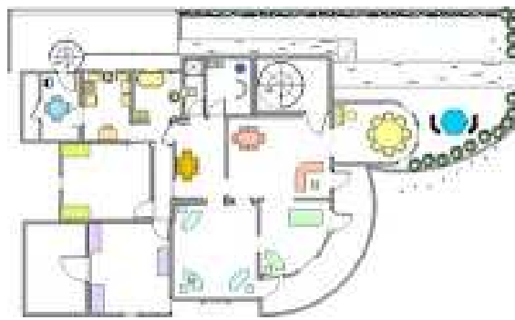
Πρώτος όροφος (στην οδό Γλάδστωνος, στην Λεμεσό)

Τα τμήματα της επαγγελματικής κατάρτισης και «Γυναίκα και μετανάστευση» διογκώνονται και αντλούν χρηματοδότηση από τα διευρυμένα προγράμματα τη ΕΕ και των ΟΗΕ. Είναι σημαντικό να σημειωθεί εδώ ότι όταν ένα άτομο υφίσταται τον κοινωνικό αποκλεισμό (λόγω φύλου ή καταγωγής ή σεξουαλικού προσδιορισμού) είναι διπλά ευάλωτο σε συμπεριφορές βίας και εκμετάλλευσης. Το πλέγμα υπηρεσιών του Κέντρου ΑΠΑΝΕΜΙ πρόσφερε μια ολιστική προσέγγιση και πολλές φορές ένα άτομο που απευθυνόταν για υπηρεσίες πρόσβασης στο κοινωνικό επίδομα σύντομα θα ξεδίπλωνε και άλλες πτυχές της προσωπικής ή οικογενειακής του κατάστασης. Αλλά και το αντίστροφο. Εκεί και η ανάγκη να εκπαιδευτεί το προσωπικό του κέντρου σε πιο εξειδικευμένες υποθέσεις όπως το χειρισμό θυμάτων βασανιστηρίων, εκπαίδευση αναγνώρισης αλλά και στήριξης θυμάτων βασανισμού. Έτσι το τμήμα «Γυναίκα και μετανάστευση» αποκτούσε μια εξειδίκευση με γοργούς ρυθμούς και Περιφερικά Όργανα και οργανισμοί από την Ευρώπη επιζητούν συνεργασία.