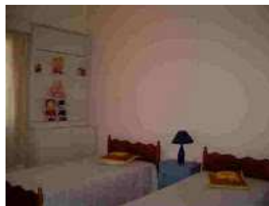
Παιδικά δωμάτια στην ά Στέγη Προστασίας στη Λεμεσό