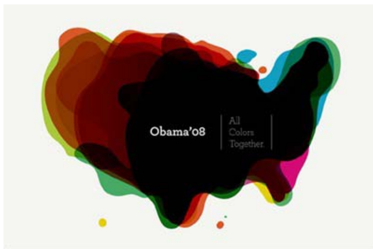
Afiche de Dmolin

Se puede encontrar ese y otros afiches en: