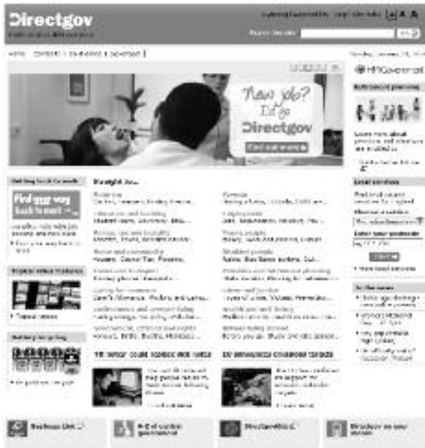
Головна сторінка порталу Directgov

кову декларацію чи заповнити анкету на закордонний паспорт і за два дні отримати його поштою. Можна знайти собі лікаря. Слід нагадати, що охорона здоров'я в Британії є безкоштовною. Звісно, в країні є й платні медичні заклади, але уряд забезпечує високу ефективність державної (безкоштовної) медицини. З огляду на те, що урядова комунікація – це не просто інформування громадян (у цьому випадку йдеться про лікарні та медичні послуги), а двосторонній зв'язок, на порталі водночас можна знайти і відгуки пацієнтів саме про ту лікарню, яка вас цікавить (приміром, хірург геніально провів операцію, а санітарки непрофесійно виконали свою роботу чи навпаки).