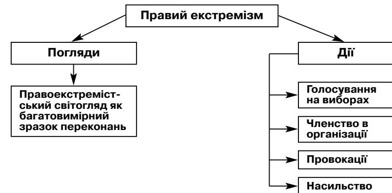
Рис. 1. Розмежування між правоекстремістськими поглядами та діями. Цит. за: [6, с. 27]

Першим кроком на шляху до конструктивної протидії правому екстремізму є чітке розмежування поглядів та дій. І погляди, і дії є складниками феномена правого екстремізму, проте характеризуються різними проявами, які, відповідно, вимагають різних контрстратегій. На правий екстремізм як проблему в Німеччині здебільшого реагують і публічно дискутують про неї лише тоді, коли вже сталося щось кричущо правоекстремістське, наприклад, правоекстремістська партія здобула успіх на виборах чи було скоєно особливо жahlливий злочин. На протипагу цьому, правоекстремістські погляди та ступінь їх поширення серед населення досить нечасто стають предметом публічних дебатів. Це викликає жаль, оскільки в основі кожного правоекстремістського вчинку лежать відповідні погляди, які є фундаментом і певною мірою ядром проблеми. До цього ж правоекстремістські погляди далеко не обмежуються лише колом організованих правих екстремістів. Хоча цей факт став відомим завдяки дослідженням, проведеним ще в 1980-х роках, проте він не був усвідомлений німецьким суспільством. Слід однак підкреслити, що далеко не кожна особа з правоекстремістськими поглядами діє згідно з ними — якби було інакше, тоді в Німеччині існувала б набагато більша проблема правого екстремізму.