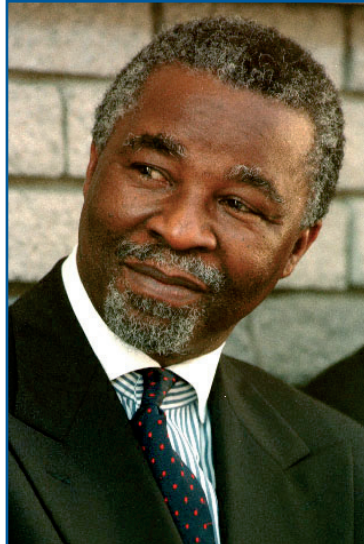
Präsident Thabo Mbeki

Präsident Mbeki lobte seine Stellvertreterin, Phumzile Mlambo-Ngcuka, die der Accelerated and Shared Growth Initiative (ASGISA) vorsteht. Die im letzten Jahr bei der Rede zur Lage der Nation verkündete Wachstums- und Beschäftigungsinitiative sieht sektorbezogene, punktuelle Interventionen für mehr Investitionen und Beschäftigung vor. Zudem verkündete Mbeki, das neue Rahmenprogramm für die Industriepolitik vorlegen zu können und versprach konkrete Maßnahmen in den Bereichen neue Dienstleistungen, Tourismus, Bio-Kraftstoffe und Chemie. Für die Sektoren Bergbau, Landwirtschaft, Pharmazie und soziale Dienstleistungen will seine Regierung ebenfalls bald