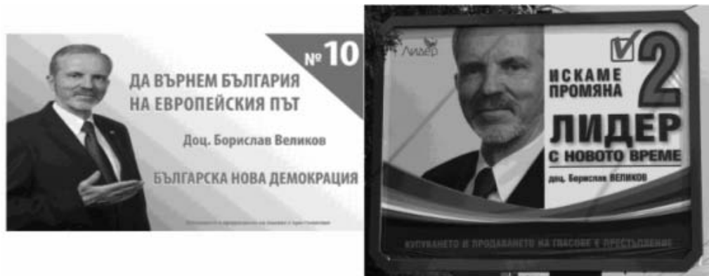
Фигура 1: Един политик, две партии