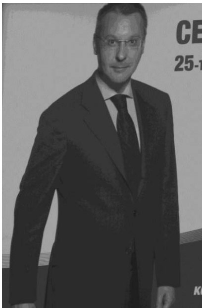
Фигура 20: Афишът на отиващия си премиер

се нови образи със стари лица; идеята за общуването бива въведена в самия образ. Ефектът е симпатичен, но само когато не остава формален, когато ПР-ът не измества посланието, когато правенето на кампания не Фигура 21: Афишът на идващия премиер (Бойко Борисов - 2007 и 2009)