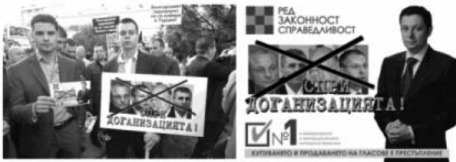
Фигура 13: Антидоганизация - 1

В основните си афиши партиите назоваха не своите приоритети, а своите противници: тройната коалиция се оказа малка за Яне Янев, та той громи Доган, Станишев, Царя и Христо Ковачки дори.