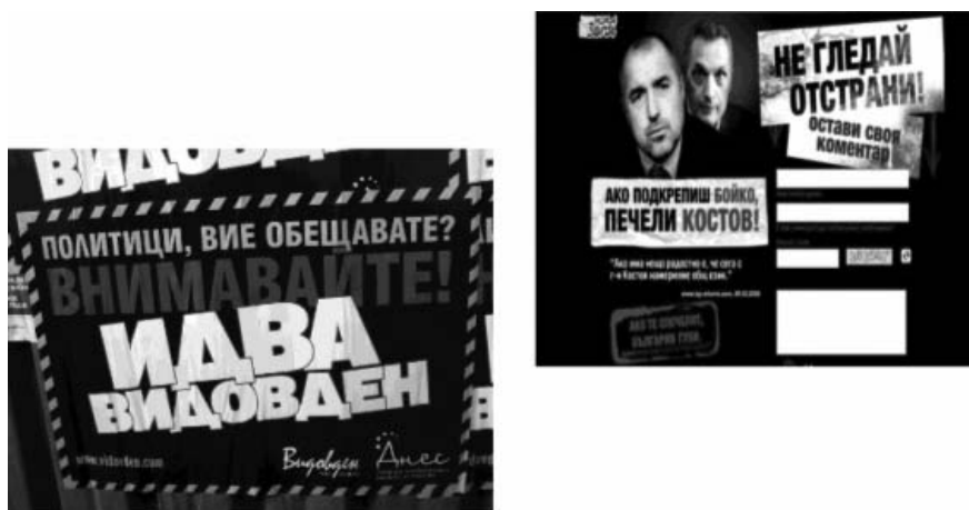
Фигура 10: Негативна кампания — ясни послания, (не)ясни автори

и спасение) — стилистиката е поразително сходна.. — черно-червени