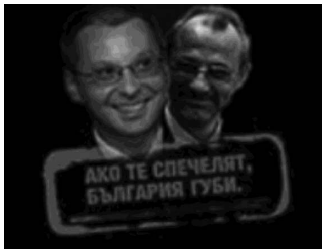
Фигура 11: Негативи отговори на негативна кампания

краски, тронав шрифт, императивност (“Внимавайте!”, “Не гледай от- страни!”)