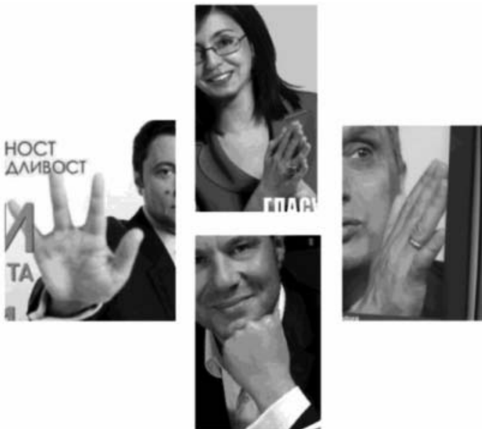
Фигура 17: Ръце вместо (нови) лица