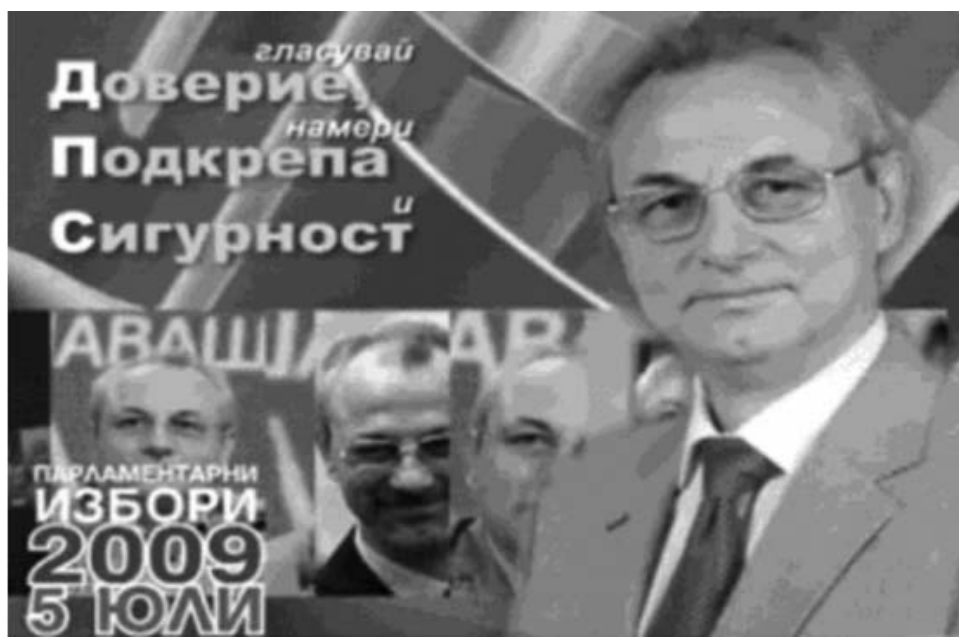
Фигура 3: Ляво-десен слоган

идентичност е диагноза и в медицината, и в политиката.