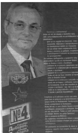
Фигура 6: Трудният баланс текст-образ

Точно същата афективно-моралистична стилистика откриваме и у основния опонент на сините — Доган: „От дълбините на съзнанието