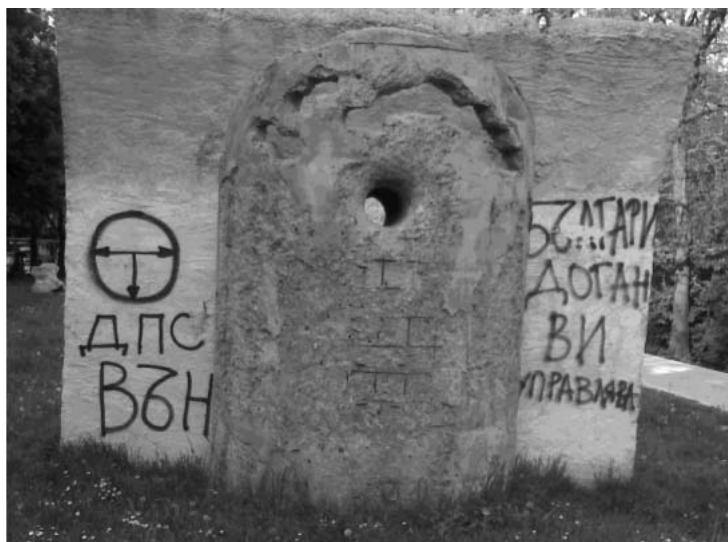
Фигура 13: Антидоганизация - 1

Можем ли да резюмираме цялата кампания с една дума? За нормални избори отговорът би трябвало да е отрицателен, звученето да е полифонично, партиите да говорят с различни гласове. Не така бе с