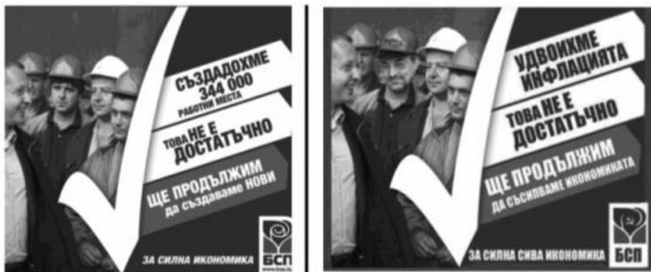
Фигура 4: Плакат и контраплакат на БСП

образът на индустриализацията от преди половин столетие.