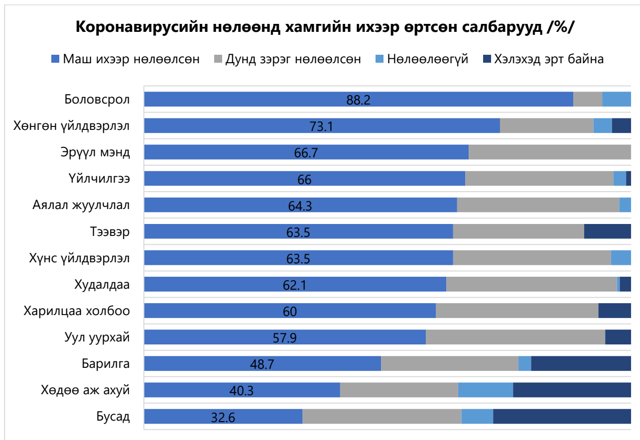
Эх сурвалж: Монголын Үндэсний Худалдаа Аж Үйлдвэрийн Танхим, 2020

Монголын Үндэсний Худалдаа Аж Үйлдвэрийн Танхимаас бизнес эрхлэгчдийн дунд түүвэрлэн хийсэн энэхүү судалгаанаас харахад хөл хорионы үеэр ажлын байр олноороо үгүй болж, олон хүн цомхотголд өртсөн байна. Нэн ялангуяа, зочид буудал нийтийн хоол, хөнгөн үйлдвэрлэл, аялал жуулчлал, банк санхүүгийн салбарт ажлын байрны тоо ихээхэн хэмжээгээр буурчээ (МУХАҮТ, 2020).