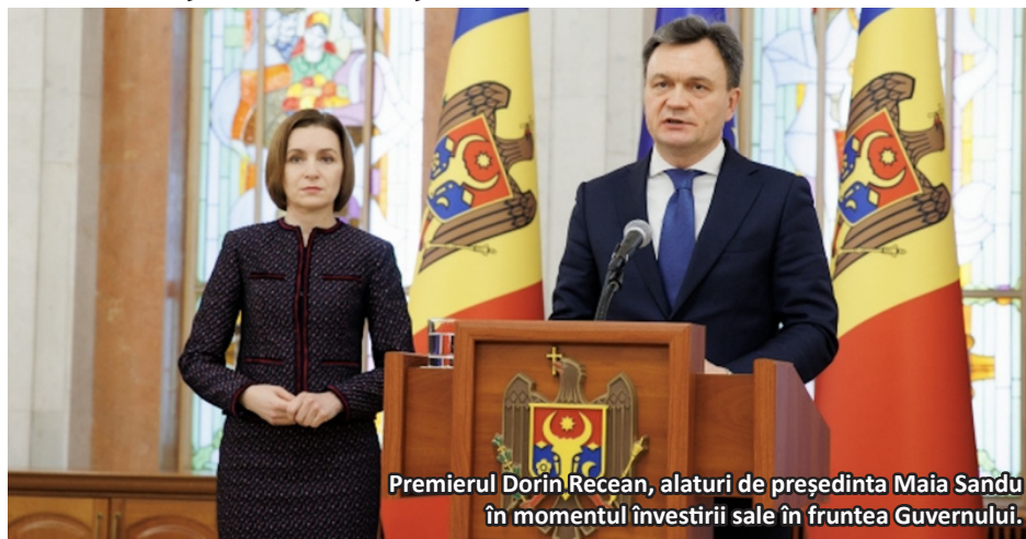
Premierul Dorin Recean, alături de președinta Maia Sandu în momentul investirii sale în fruntea Guvernului.

Noul Guvern de la Chișinău, condus de Dorin Recean, un lider cu un profil axat pe chestiuni de securitate și cu trecere în România și SUA, a confirmat faptul că Moldova se pregătește de o nouă optică în abordarea problemelor de securitate ce urmează pentru Moldova. De altfel, trei dintre prioritățile sale se referă la asigurarea