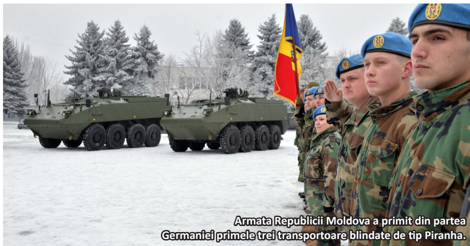
Armata Republicii Moldova a primit din partea Germaniei primele trei transportoare blindate de tip Piranha.

Noua etapă a invaziei ruse în Ucraina aduce cu sine și o serie de riscuri de securitate pentru Republica Moldova. Acestea au fost exprimate deja public prin vocea președinteia Maia Sandu care a oferit o serie de amănunte despre cum Rusia plănuiește deja destabilizări la Chișinău, iar vehiculul principal îl reprezintă protestele plătite ale unui partid politic