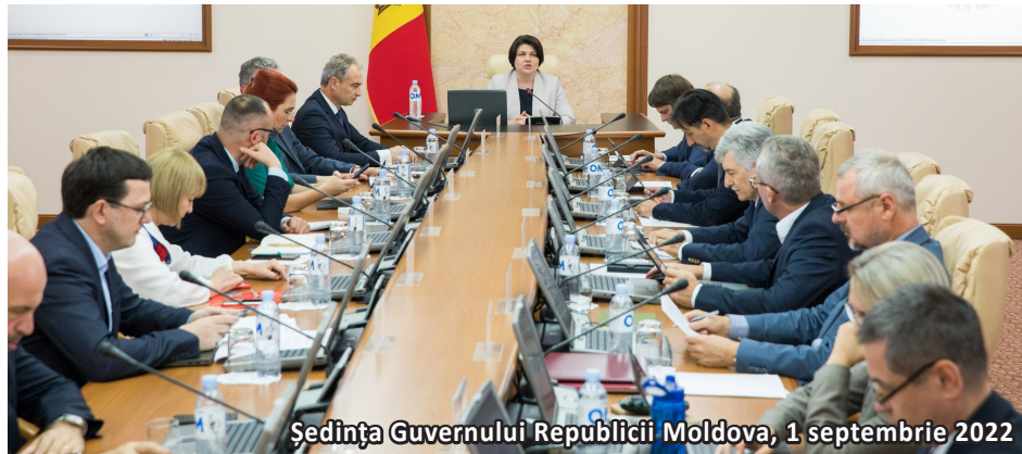
Sedința Guvernului Republicii Moldova, 1 septembrie 2022

Primul an de guvernare a actualului cabinet de miniștri, condus de premierul Natalia Gavriliță, a consemnat numeroase crize suprapuse, dar și oportunități externe unice în istoria de 31 de ani a Republicii Moldova.